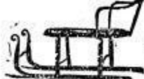
Kinderschlitten von 2.50 Mk. an