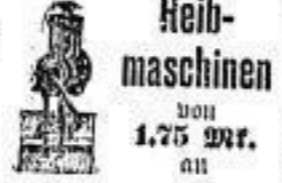
Reibmaschinen von 1.75 Mk. an

Laubsäge- und Werkzeugkasten, Kohlenkasten etc.