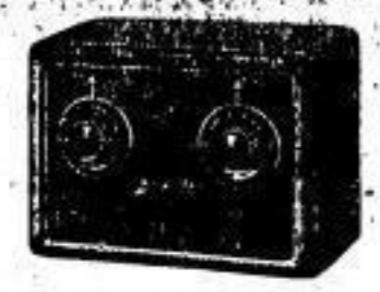
Lumophon „52 W“ 2-Röhren-Empfänger ohne Steckerschraub RM 69.— einschl. Röhren