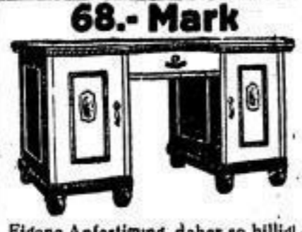
Eigene Anfertigung, daher so billig!

68.- Mark Große Auswahl Herren-, Speise-, Schlafzimmer, Küchen, Standuhren, Bücher- und Kleiderschränke, Rauchtische, Flurgarderoben, Chaiselongue, Reformbetten usw. Zahlung ganz nach Wunsch! Möbelhaus Hahn Tischlermeister Lange Straße 5 Möbelhandlung