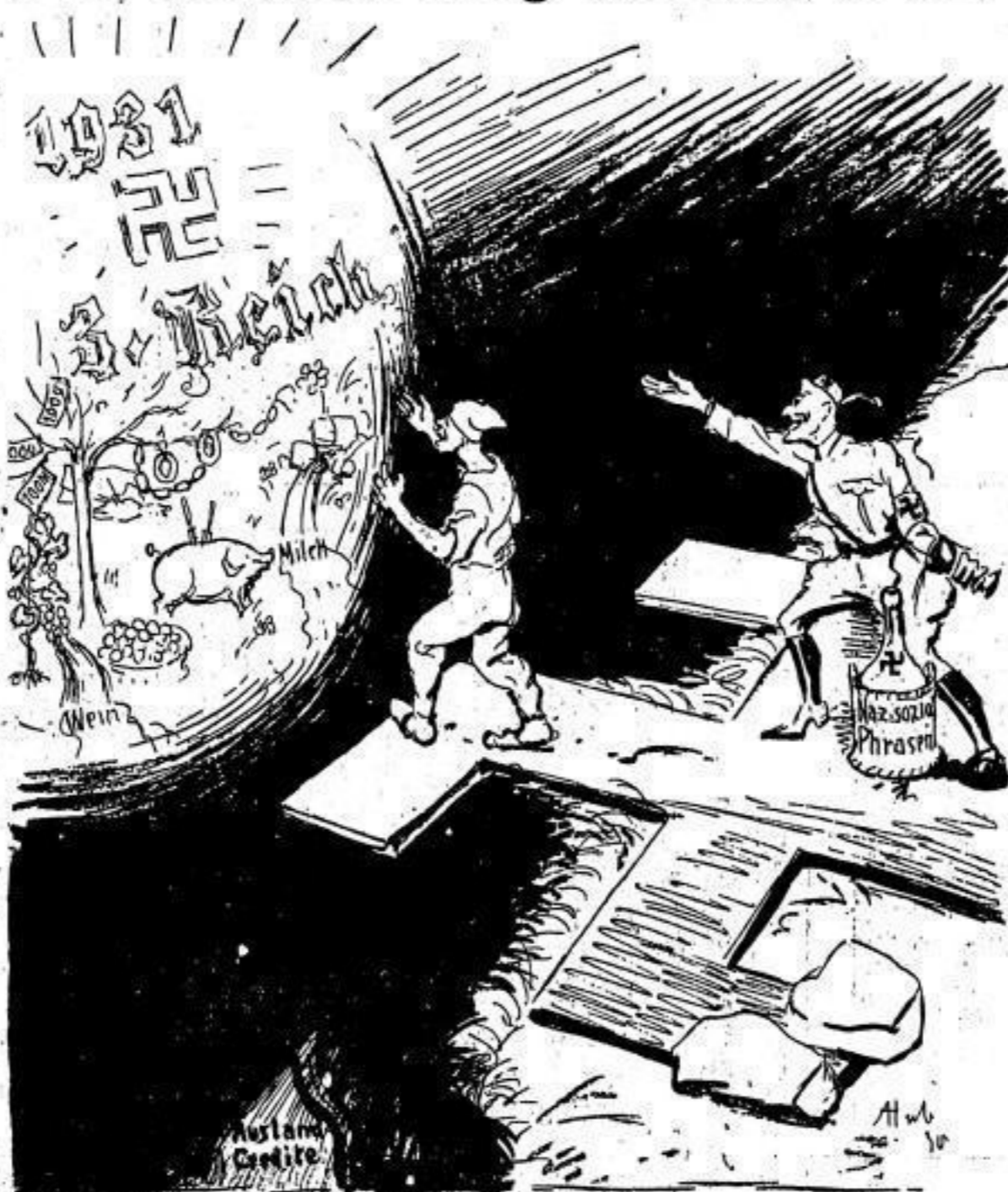
Nazl-Mephisto: Betrunken ist er schon - jetzt noch den letzten Schritt

Mein Vorschlag scheint in schroffem Gegensatz zu den von allen Seiten geforderten Sparmaßnahmen zu stehen, denn zur Arbeitsbeschaffung im großen Ausmaße sind natürlich auch große Geldmittel nötig. Aber man bedenke doch, daß die Nachforderung von 10 1/2 Millionen Mark für das laufende Jahr vor allem deshalb notwendig wurde, weil die Zahl der Wohlfahrtserwerbslosen so außerordentlich gewachsen war. Mit diesen 10 1/2 Millionen Mark würde sich in der Arbeitsfürsorge ein ganzes Heer von Arbeitslosen beschäftigen lassen, vorausgesetzt natürlich, daß bei der Auswahl der Arbeiten mit der nötigen Sorgfalt, wie schon bisher, vorgefahren würde. Außerdem haben uns rohe Ueberrechnungen bei den in der Arbeitsfürsorge ausgeführten Arbeiten gezeigt, daß die Summe für Arbeitslohn usw. nur unwesentlich höher ist, als die Summe, die wir an Fürsorgeunterstützung an die in Arbeit Stehenden hätten zahlen müssen.