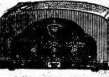
Lumophon „30 W“ 3-Röhren-Schirmgitter-Fernempfänger RM 126.50 ohne Röhren