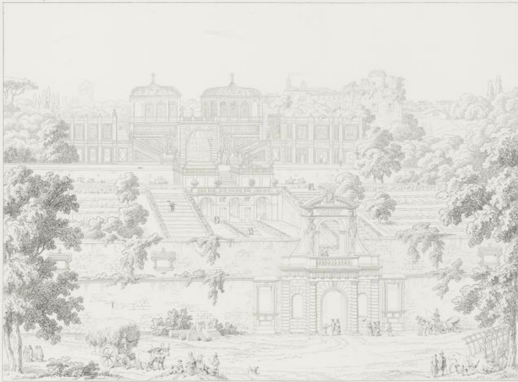
VUE INTERIEURE DES JARDINS FARNÈSE PRIS DE DESSUS DES VOUTES DE LA BASILIQUE DE CONSTANTIN.