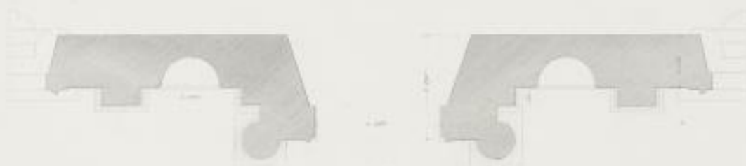
Plan et Elevation de la Porte d'Entrée.