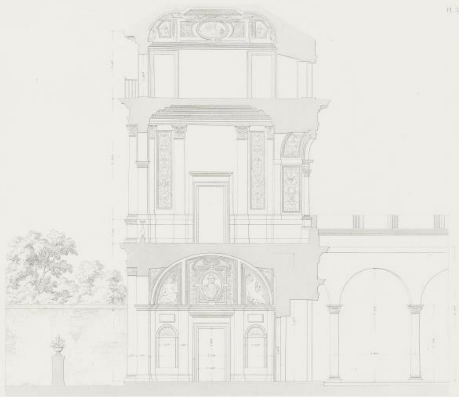
Coupe sur la largeur du Bâtiment du fond de la cour.