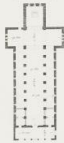
Plan de l'Église de SS. Vinomo et Anastasio