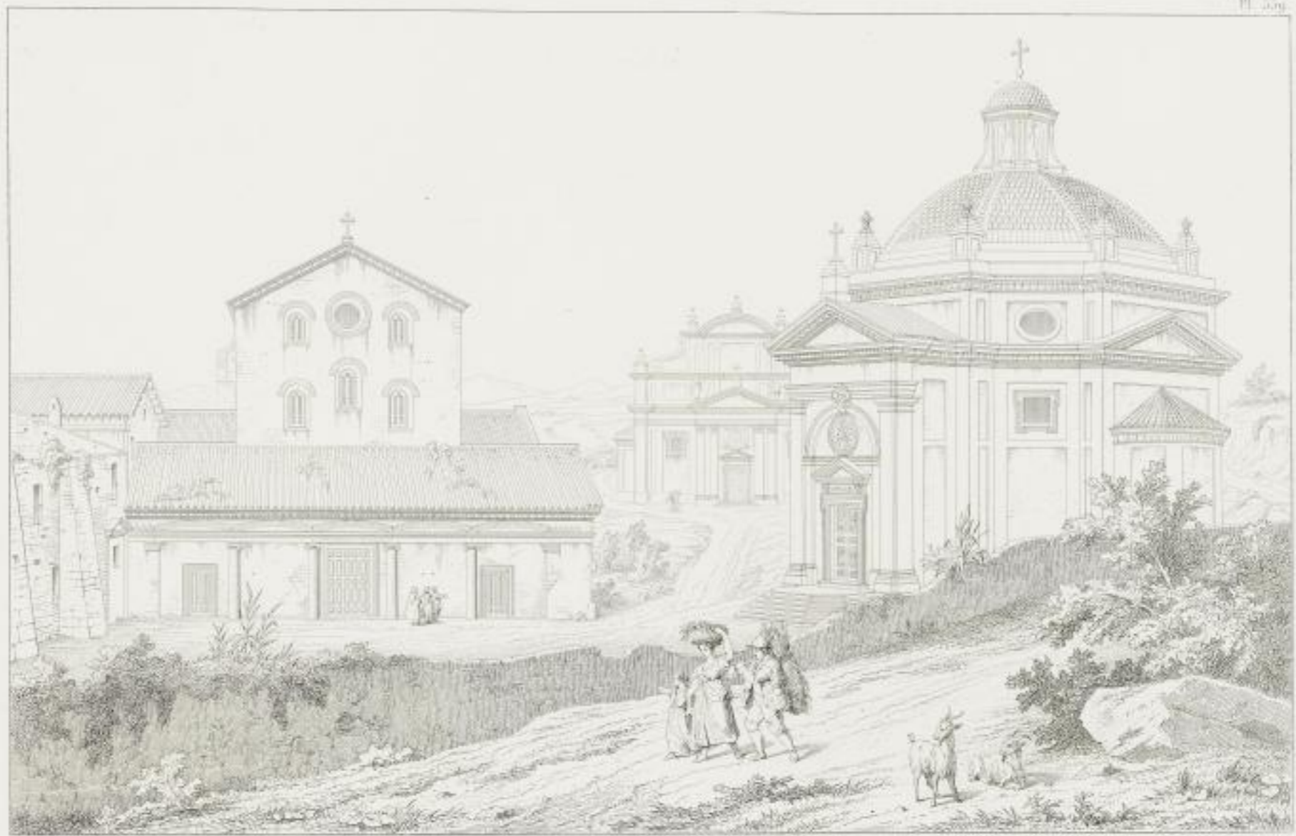
VUE GÉNÉRALE DES TROIS ÉGLISES REPRÉSENTÉES CI-DESSOUS.

A. Église exécutée par Giacomo della Porta