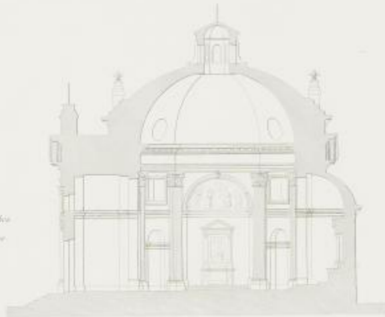
Coupe sur l'Église S. M. Seba ved.

B. Église exécutée par Gian Barozzi da Vignola