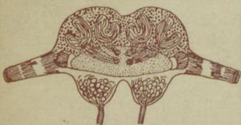
Seelenorgan des Ameisenarbeiters.