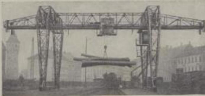
Krane für alle Zwecke und in jeder Tragkraft