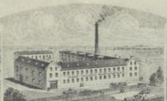
ZWEIGFABRIK EGER i. BÖHMEN