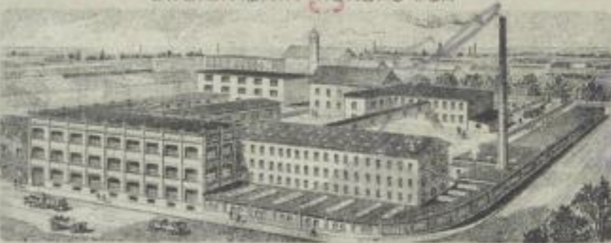
ZWEIGFABRIK WERDAU i.S.A.