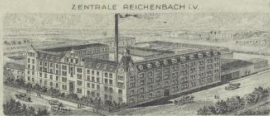
ZENTRALE REICHENBACH i.V.