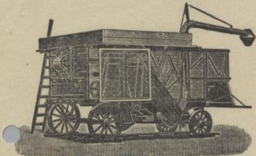
Fernsprecher: Nr. 51954 Amt Leipzig