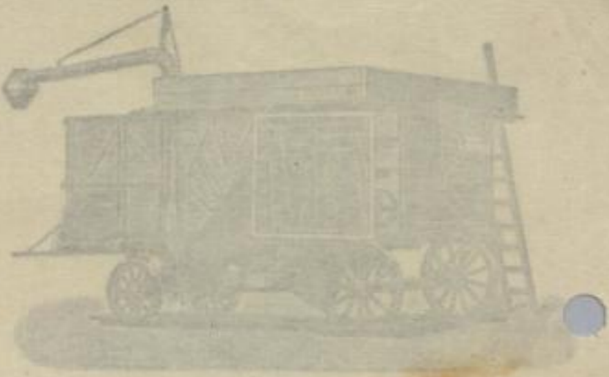
Fortwender Nr. 2184 Am Leipzig