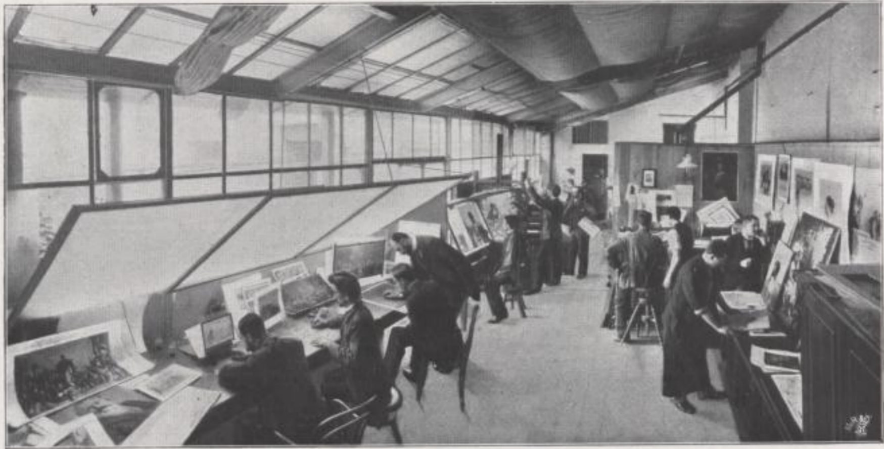
Saal für Kupferretouche.