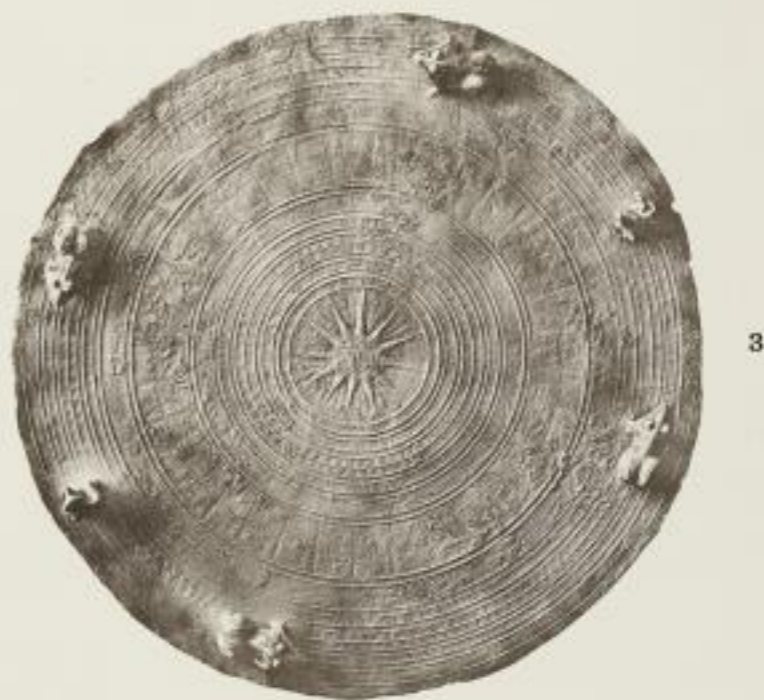
Pauken des I. Typus (Nr. 8 u. 9 Batavia, 13 Dresden): 1 Banjumening, 2 Diéng Plateau, 3—4 Südchina.