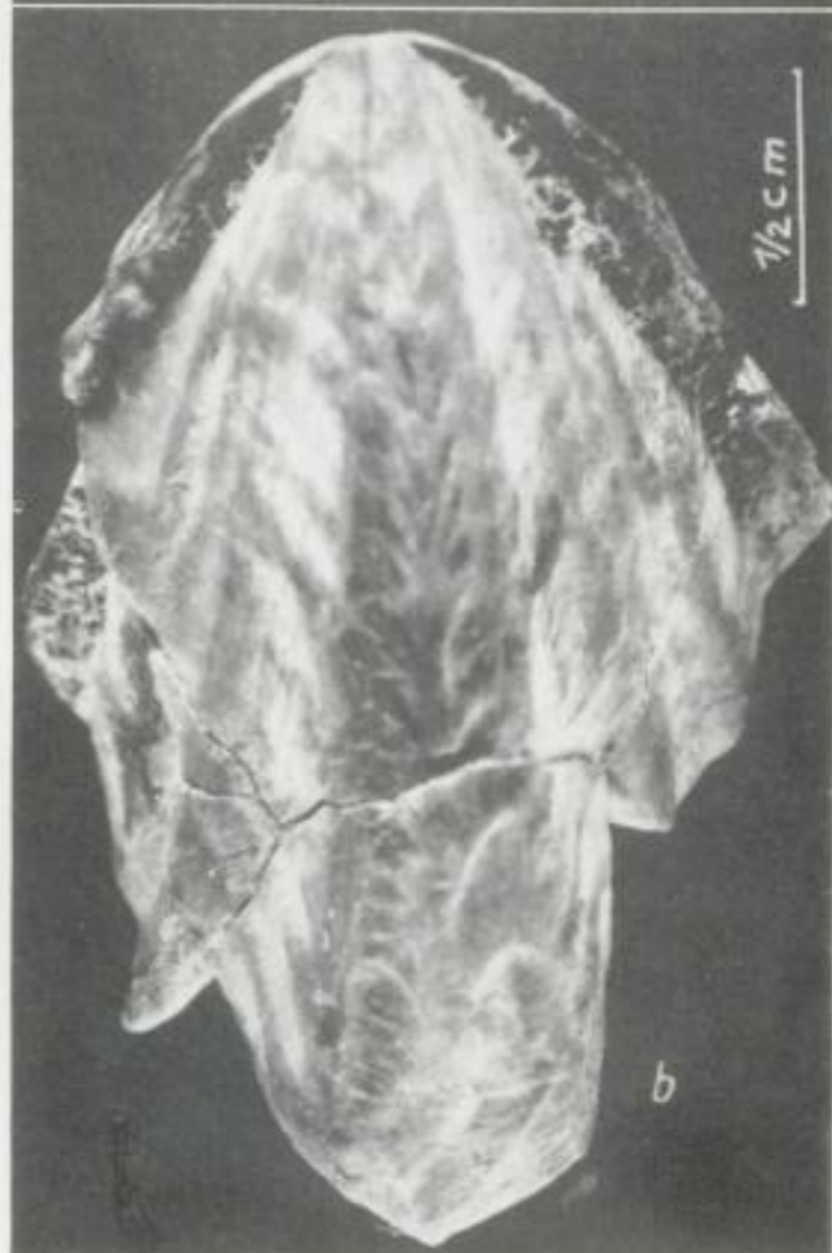
Abb. 10. Conchorhynchus avirostris , a) von vorn, b) ventral. Kaufläche des gleichen Exemplars vgl. Abb. 6a. Ob. Muschelkalk von Laineck bei Bayreuth (Nr. 50/14)