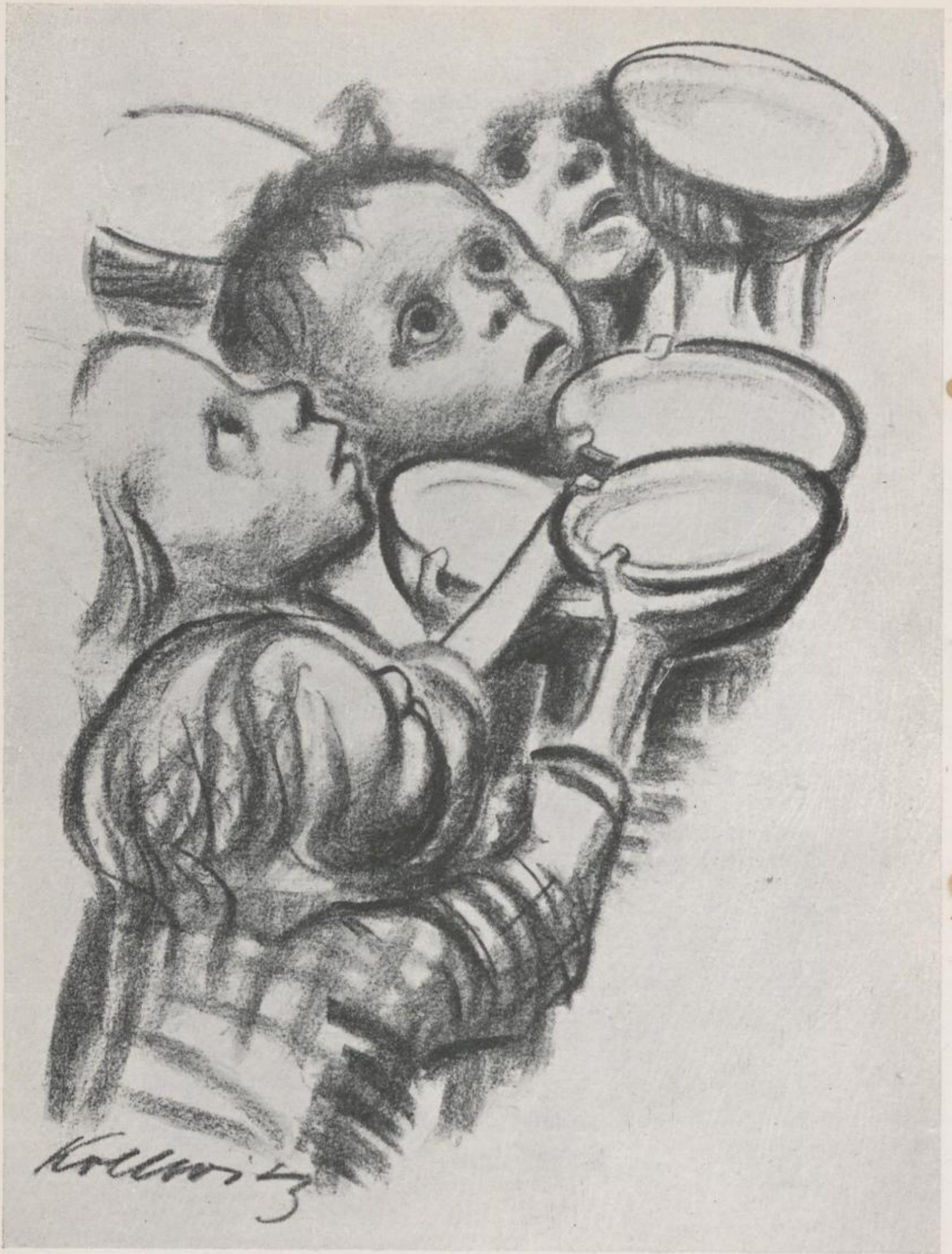
16 Käthe Kollwitz, Deutschlands Kinder hungern – Kat.-Nr. 49