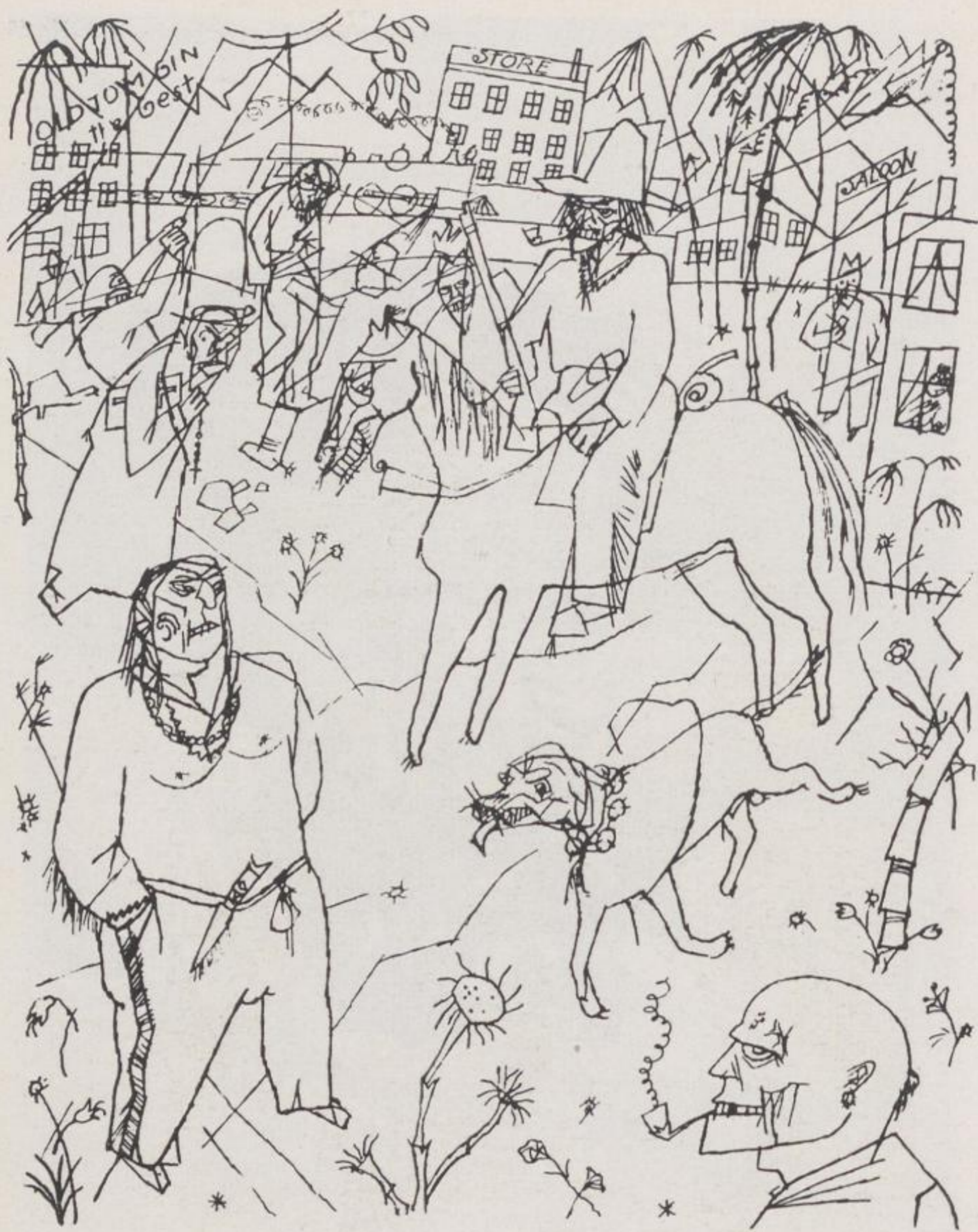
12 George Grosz, Wildwest – Kat.-Nr. 25