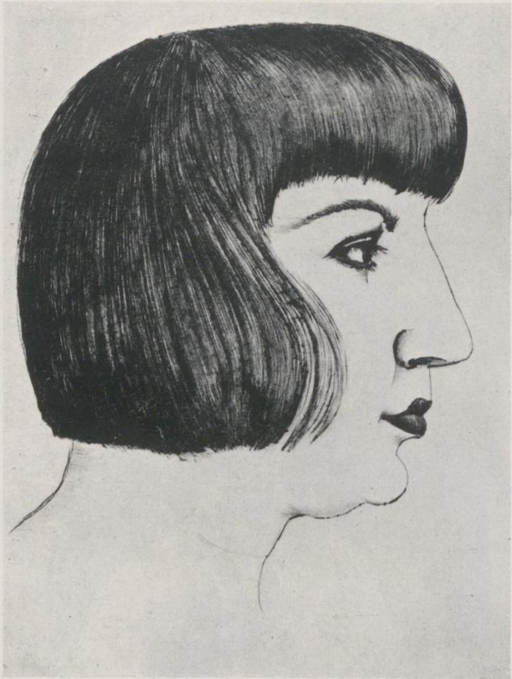
14 Otto Dix, Frauenkopf im Profil – Kat.-Nr. 16