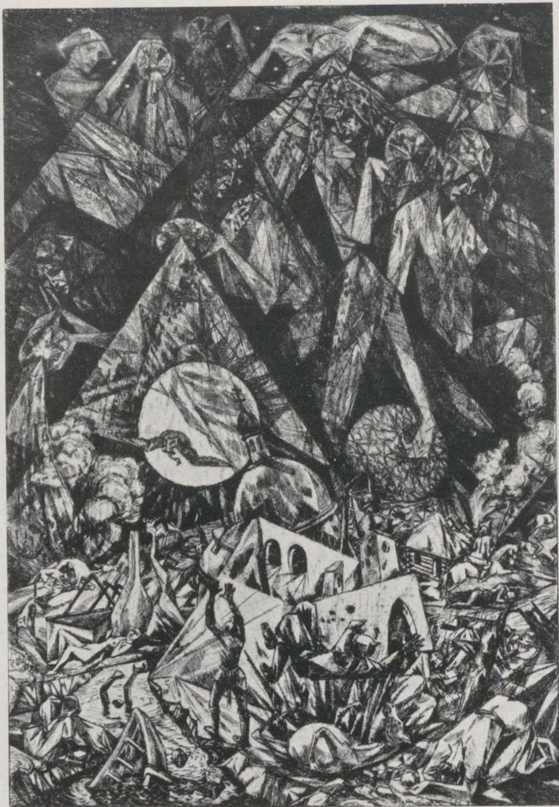
8 Heinrich Vogeler, Die Geburt des neuen Menschen – Kat.-Nr. 105