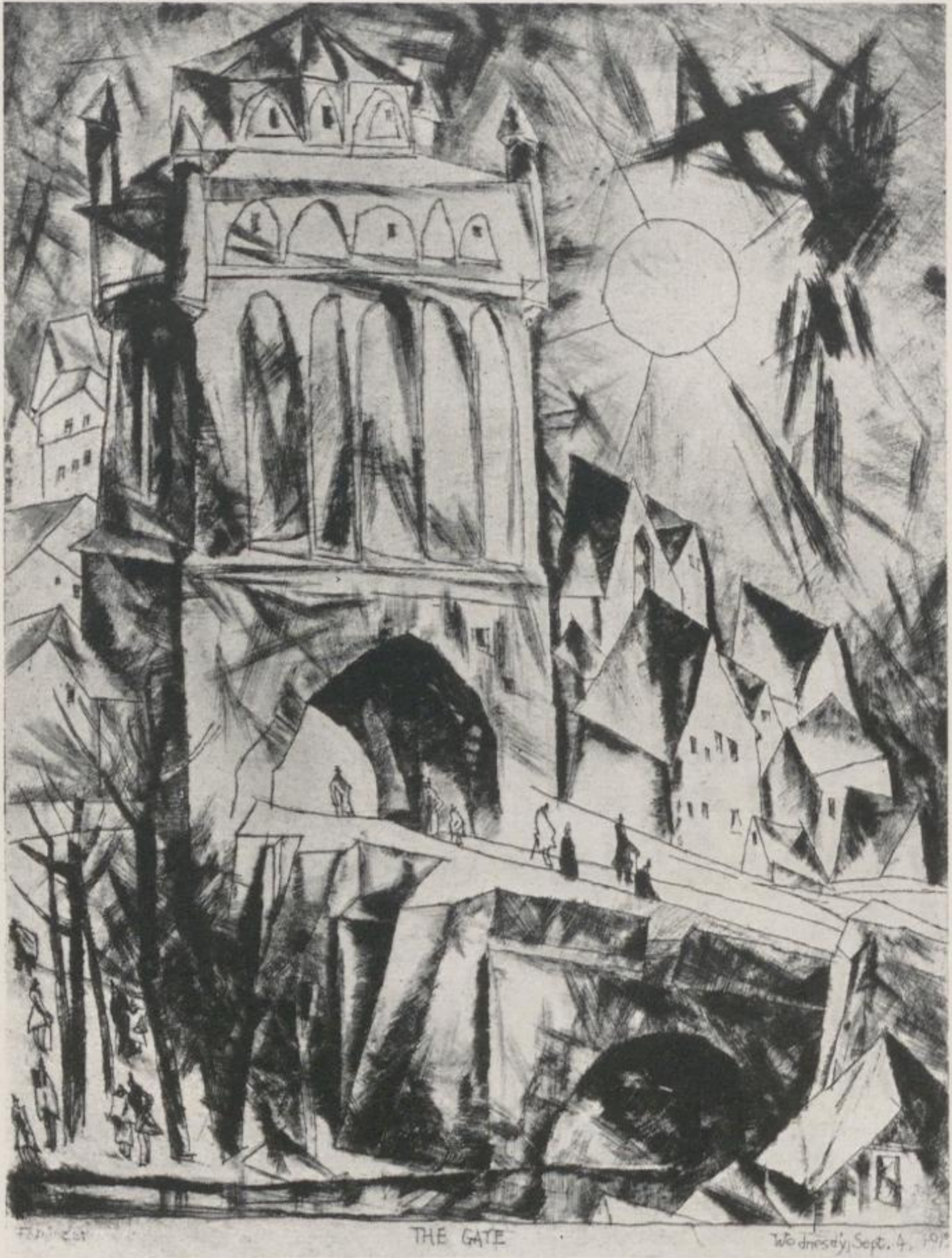
2 Lyonel Feininger, Das Tor – Kat.-Nr. 19