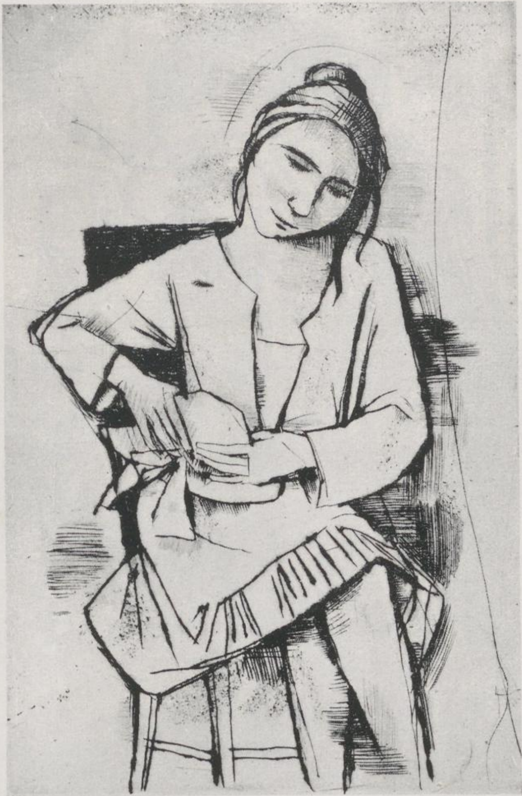
5 Carl Hofer, Die Putzmakerin – Kat.-Nr. 36