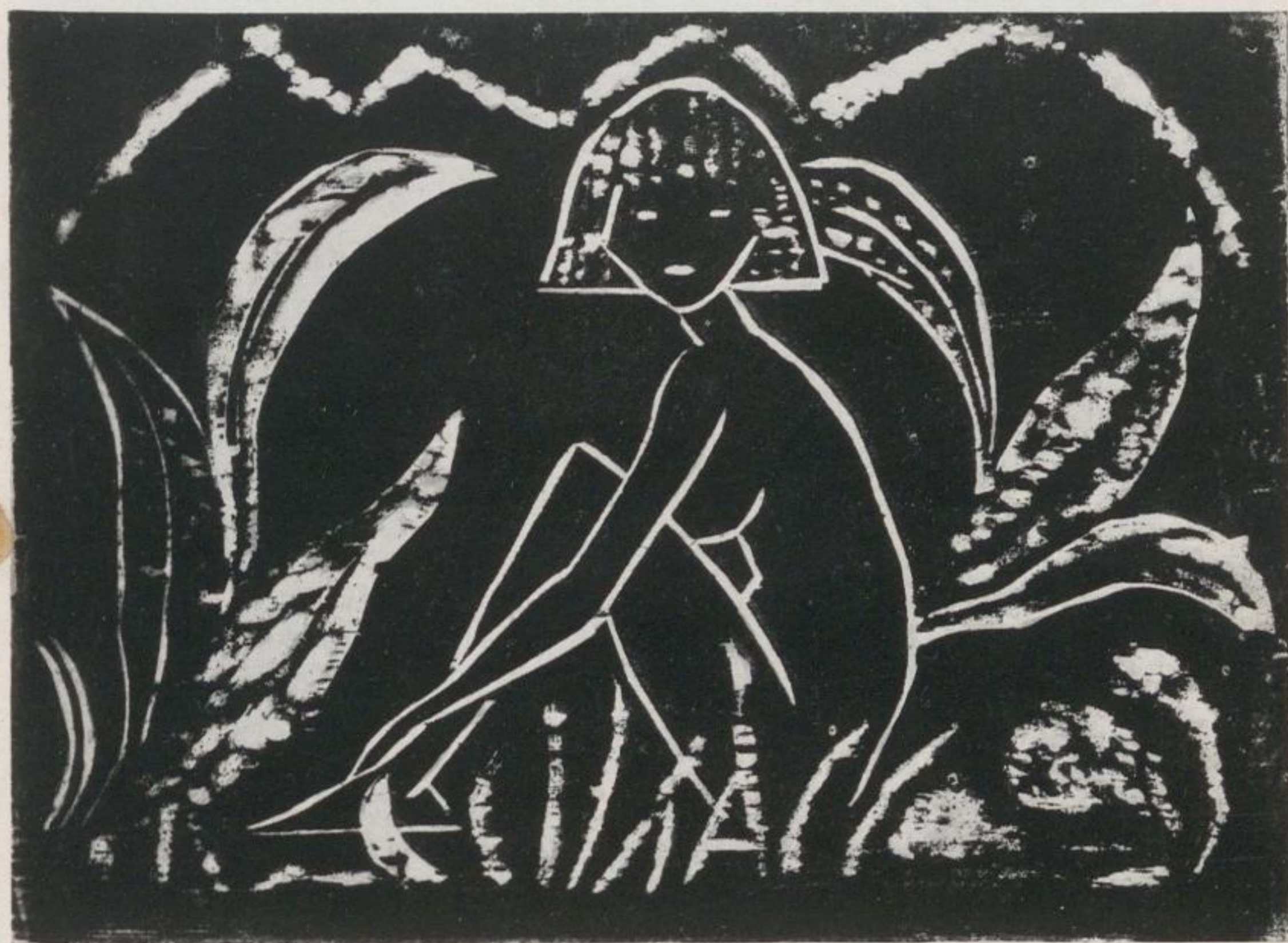
Müller, Otto: Mädchen im Schilf. 1911. Graphik. 10 x 15 cm. Kat.-Nr. 63.