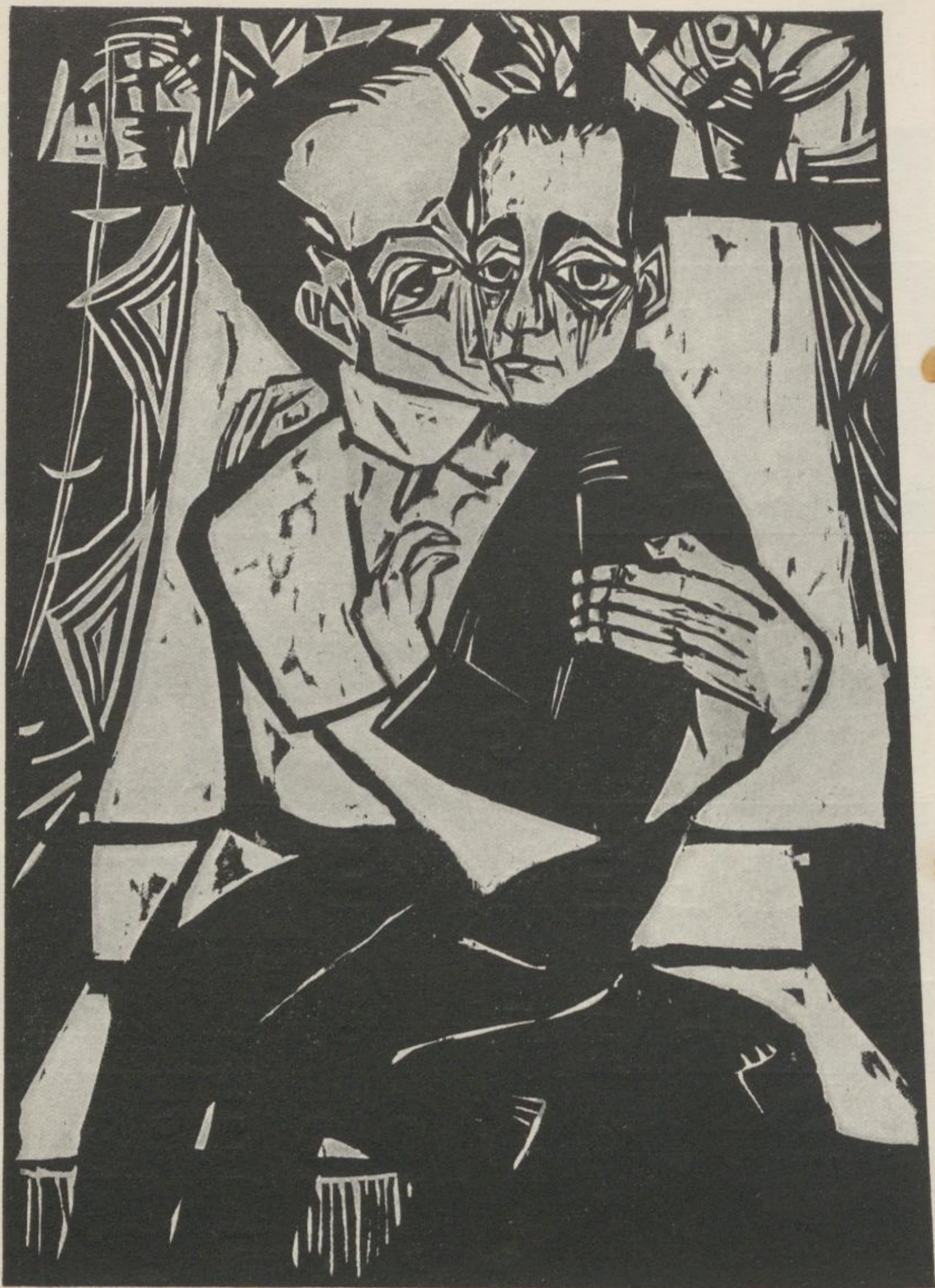
1 Erich Heckel, Geschwister – Kat.-Nr. 28