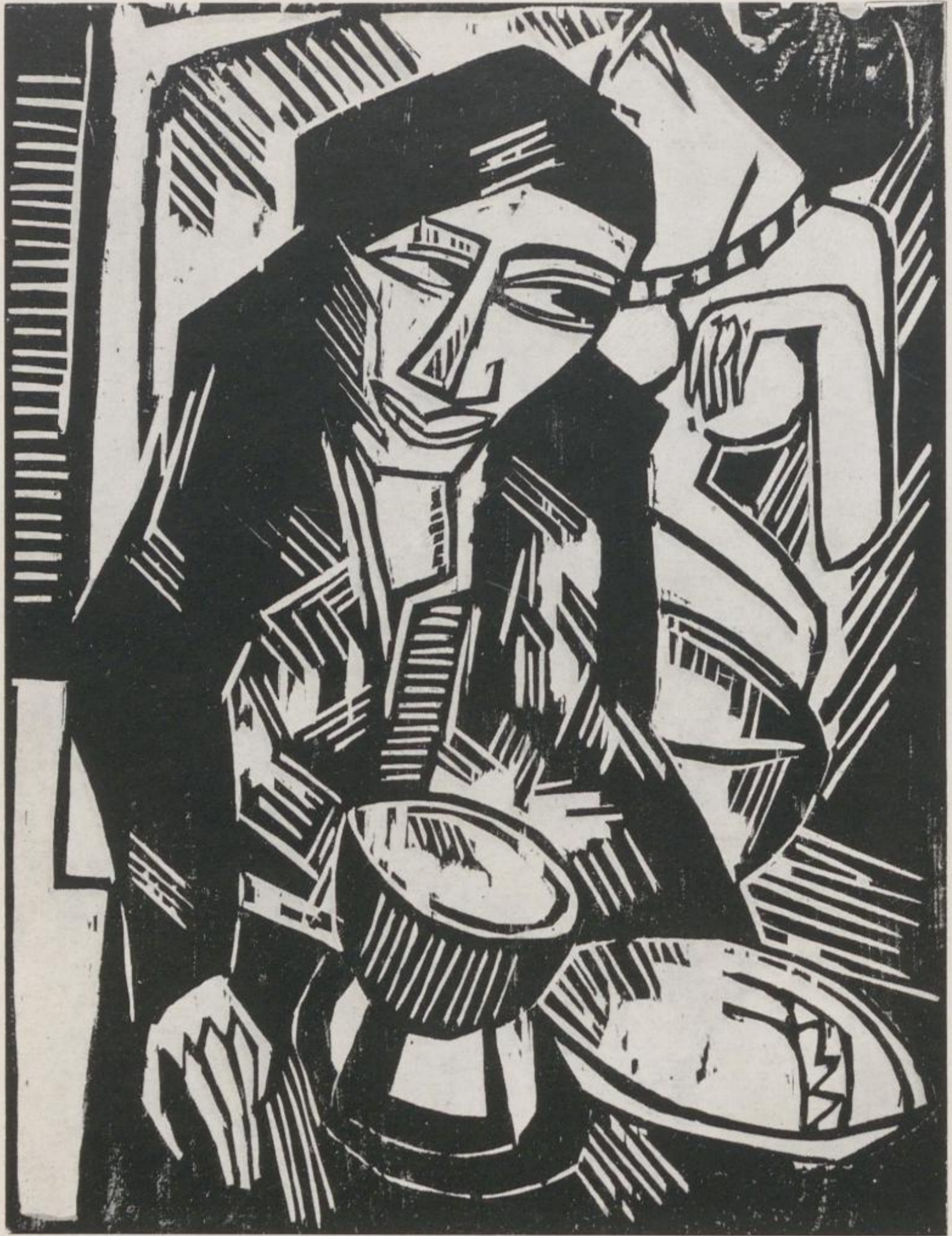
6 Karl Schmidt-Rottluff, Melancholie – Kat.-Nr. 92