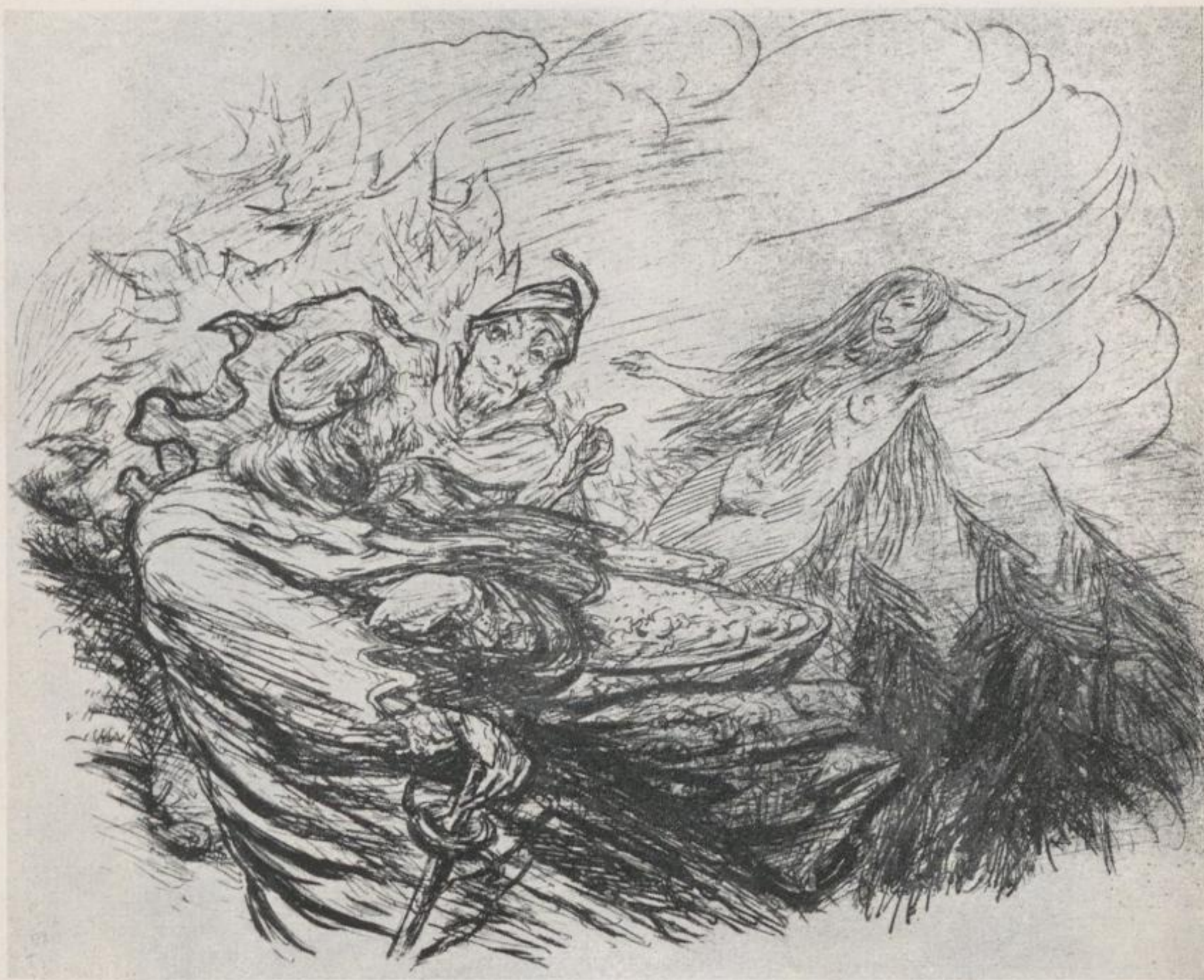
9 Alfred Kubin, Faust und Lilith – Kat.-Nr. 53