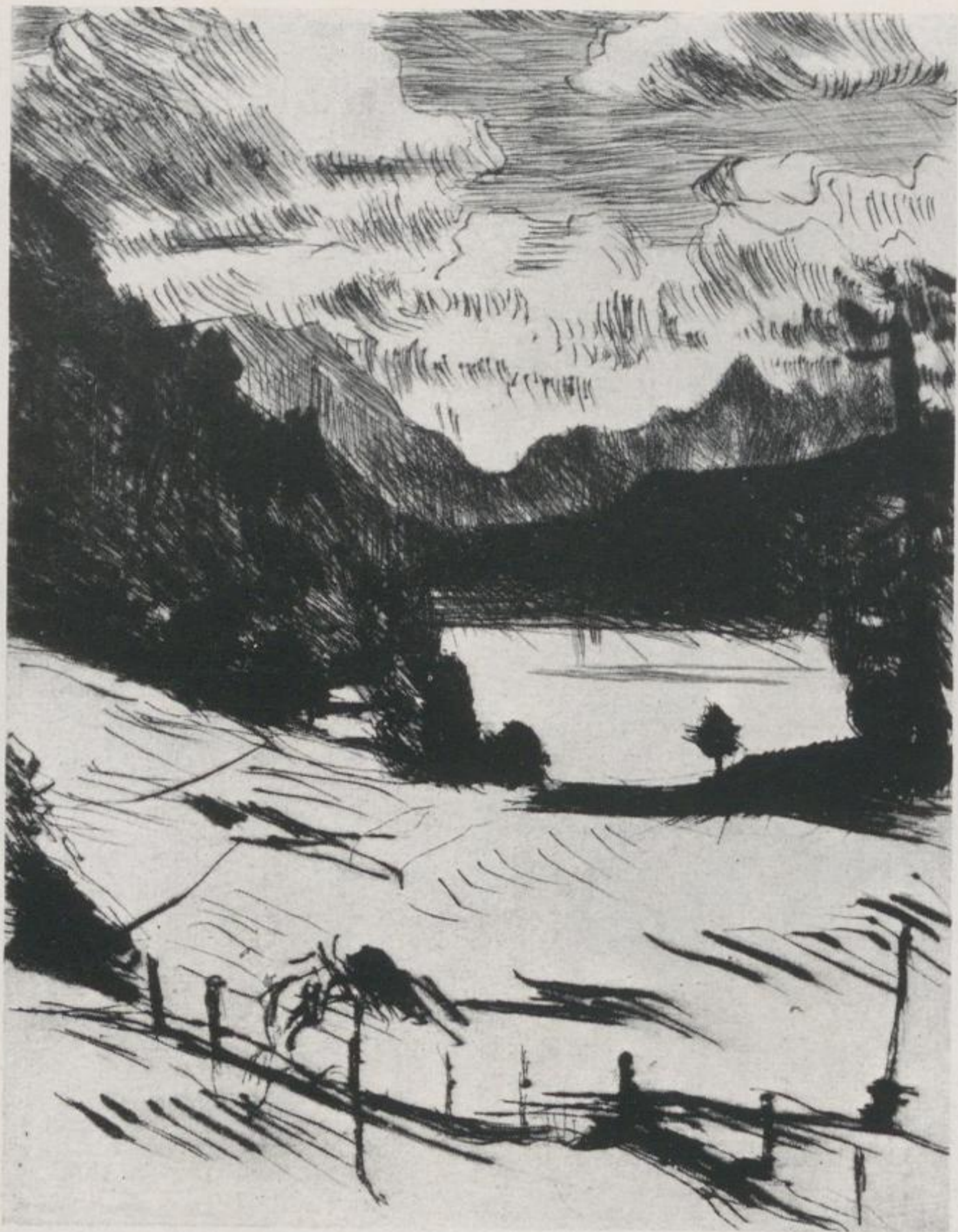
10 Lovis Corinth, Am Walchensee – Kat.-Nr. 10