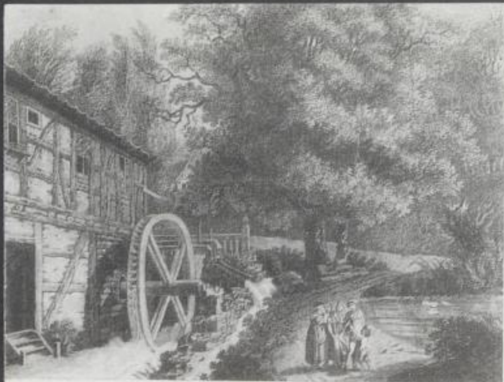
Oben: H. B. Wjela, Alte Mühle in Kreba, Zeichnung, um 1800