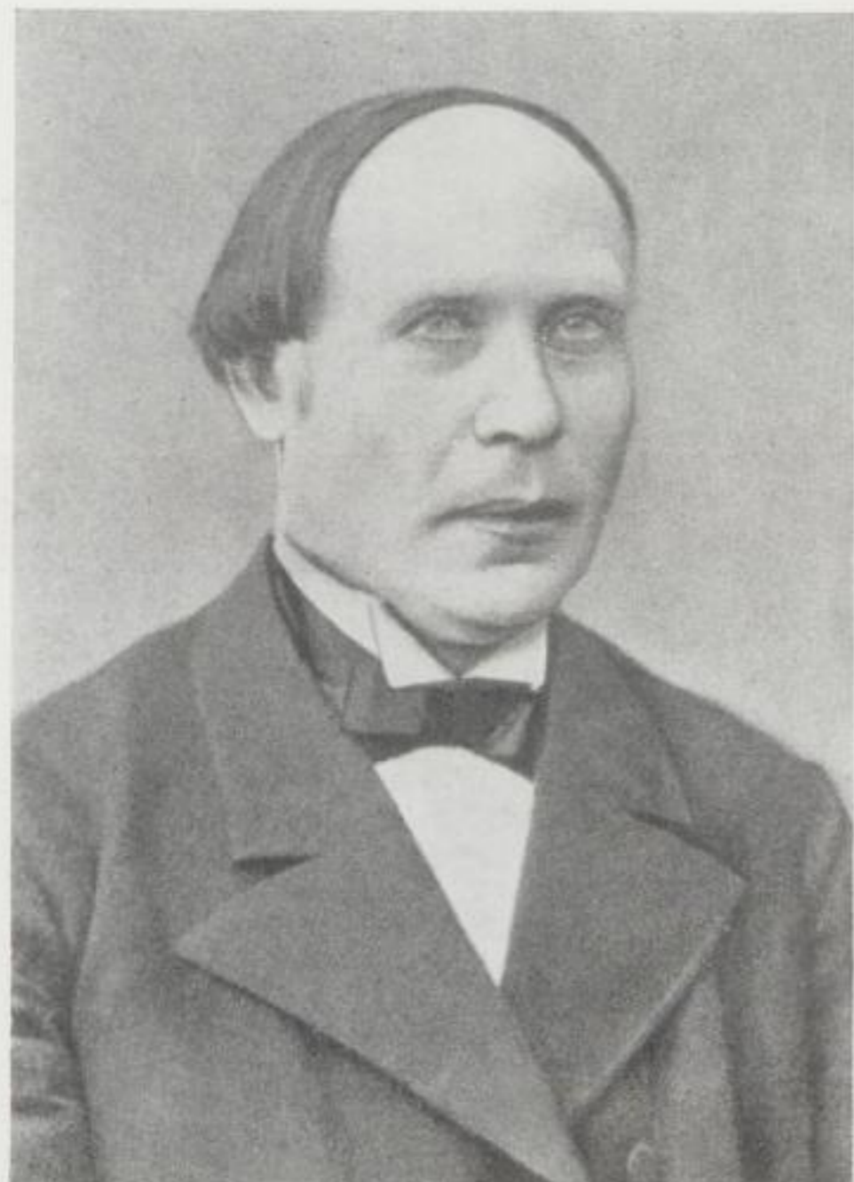
Links: Der sorbische Komponist K. A. Kocor (1822–1904)