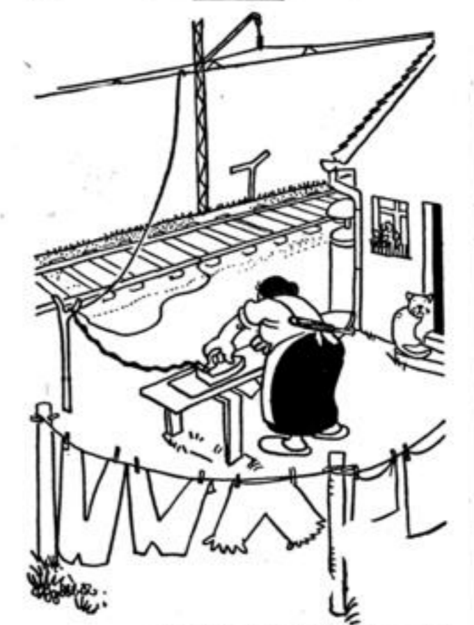
Zeichnung: Eugen Dubel-Bavaria - M. Elektrischer Bahnbetrieb.

Silberrätsel: 1. Fentast, 2. Hoquejori, 3. Esimo, 4. Unterkiefer, 5. Dortmund, 6. Edison, 7. Fuchsbau, 8. Erdbeben, 9. Hindenburg, 10. Labiau, 11. Triton, 12. Rimrod, 13. Zimperfeld, 14. Gysler, 15. Watte, 16. Oberammergau, 17. Artischode, 18. Nigl, 19. Vafis, 20. Egmon: Freude fehlt nie, wo Arbeit, Ordnung und Treue ist! Austauschrätsel: Nachbar - Diadem - Schafal - Schweden - Nachnahme - Sender - Tafel - Edelweiß - Jena - Herder - Mannheim - Lagune - Braten - Rathaus. - Nach dem Schaden, nach der Zeit weiß jedermann guten Rat.