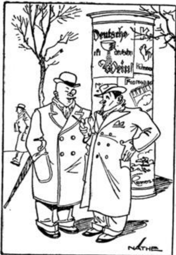
Zeichnung: Wätje — M.

Wer kann rechnen?: In der Klasse waren 5 sechsjährige, 13 siebenjährige und 29 achtmährige Schüler. T ü c h t i g s c h ä t t e l n : Spatier — Ober — Wahl — Maus — Estrich — Rebus — Feter — Eiger — Rauch — Insel — Edwin — Repos. — Sommerferien.