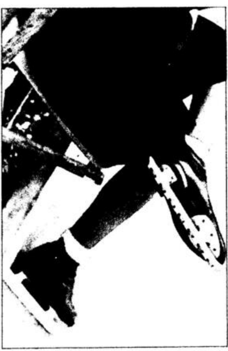
Die braucht nicht zu warten... Die braucht nicht zu warten...