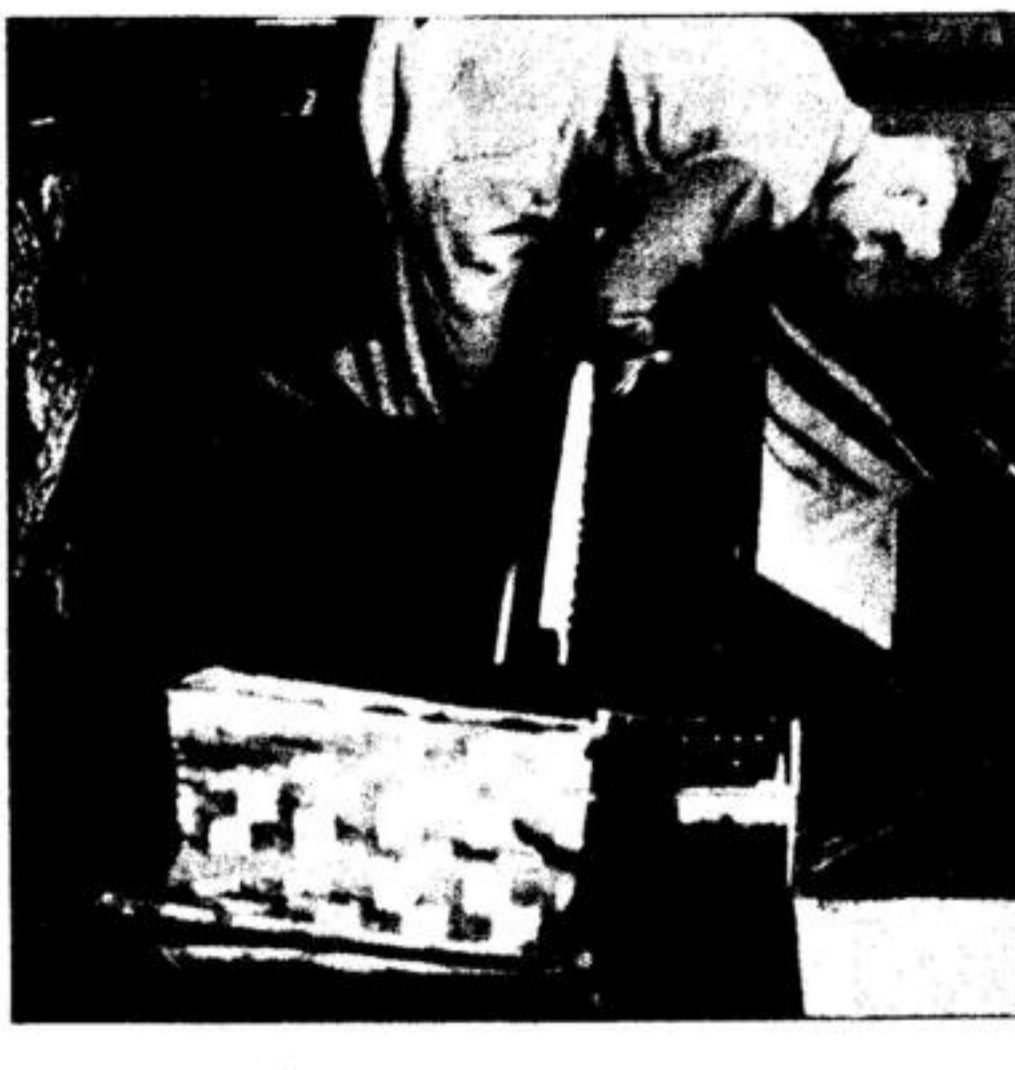
Aufnahmen... Aufnahmen: Presse-Photo...