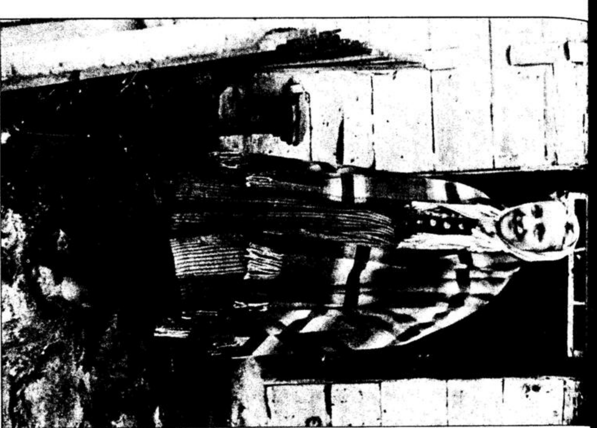
Wieder in der Heimat... Durch die jüngeren Kämpfe...