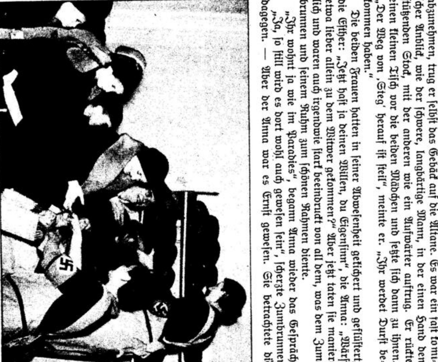
Lebensmittelausgabe in Thorn... Ein Inhaber der OTCB...