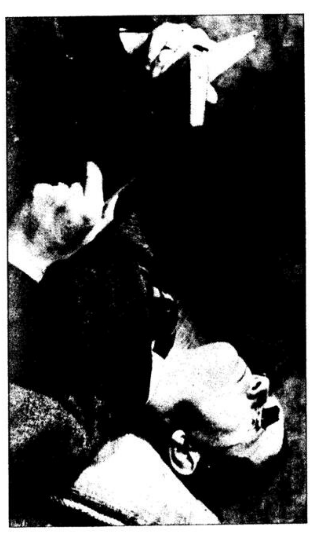
Das Spritzenpumpen... Das Spritzenpumpen...