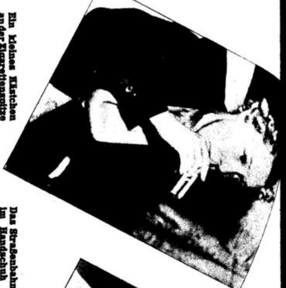
Die kleine Karbinen... Die kleine Karbinen...