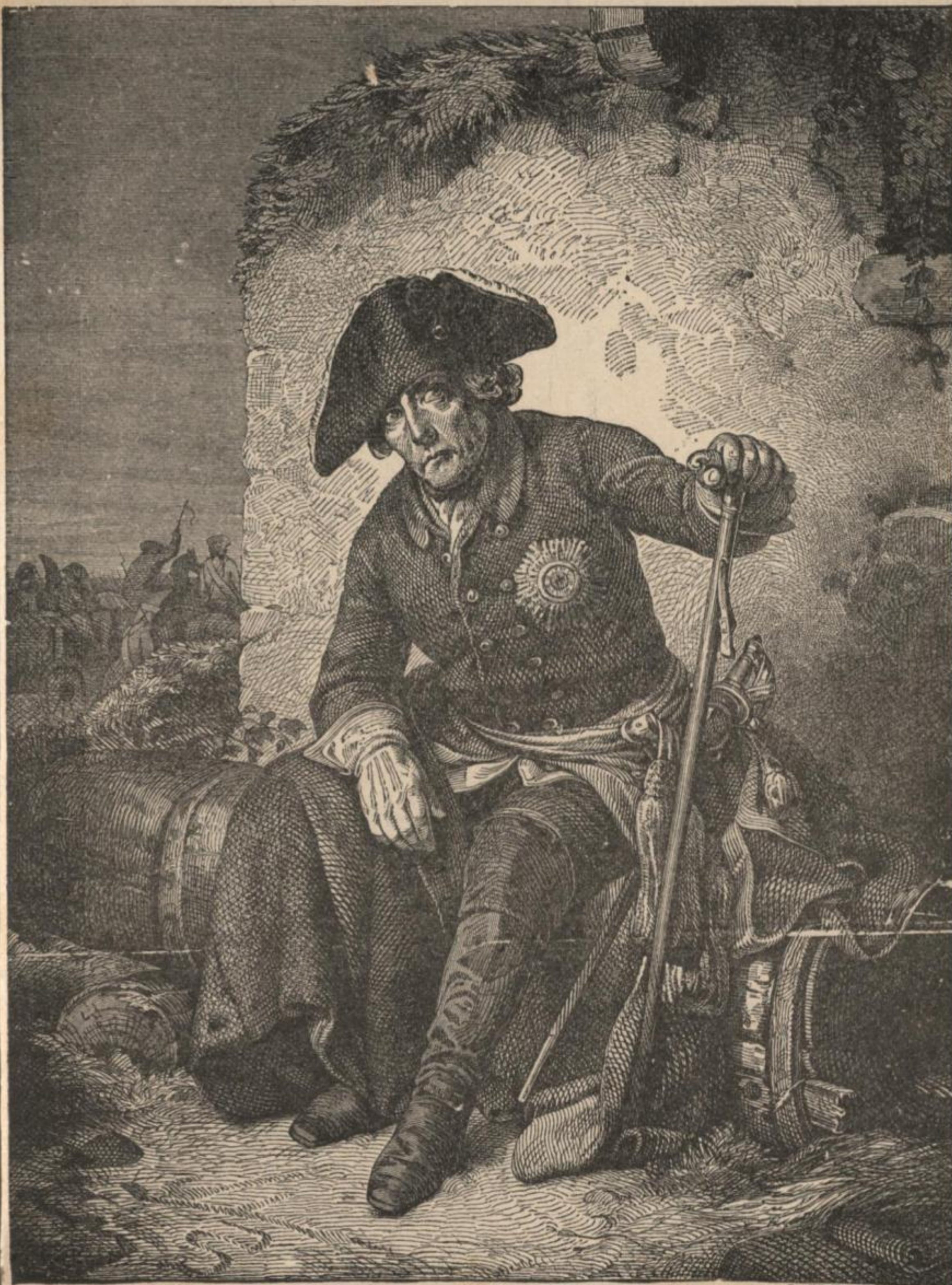
Bjedrich II. po nadpadže pola Bukcz.