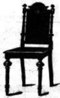
Säulen-Stuhl, polirt, mit echt Kirschbaum-Eich. Mk. 7,50.