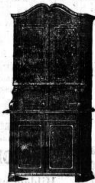
Küchenschrank, eiche lackirt, wie Zeichnung, mit Holz- oder Glasüren. Mk. 25,00.

Möbel-Fabrik und Magazin, gegründet 1866. 9875 DRESDEN-N., Görlitzerstrasse 21. Telephon Amt II 2504.