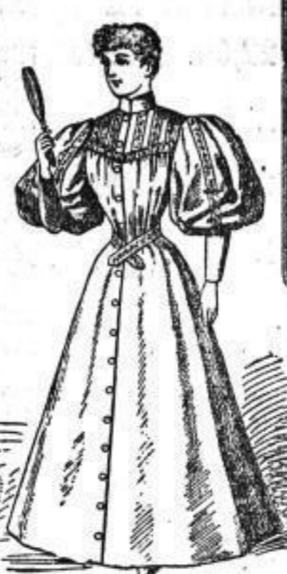
Barcent-Morgen-Kleid Koller und Aermel mit Bordüre besetzt. Mk. 6.50. Einfache Barcent-Morgen-Kleider von Mk. 5.-- an