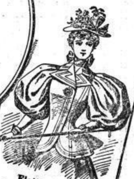
Flottes Jackett in mod. Jacquardstoff Mk. 18.-- in weichen Chertol Mk. 22.--