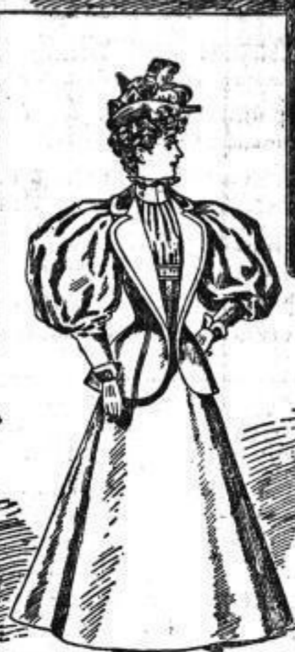
Flottes Jacket-Kostüm aus praktisches Chertol- oder Leder- stoffen Mk. 17.-- 21.-- 26.--