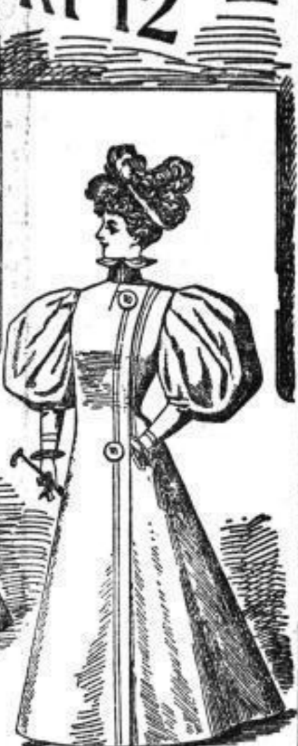
Fescher Regen-Paletot in modernen Heppentoffen Mk. 20.-- 22.-- 26.-- Regen-Paletots von Mk. 5.-- an