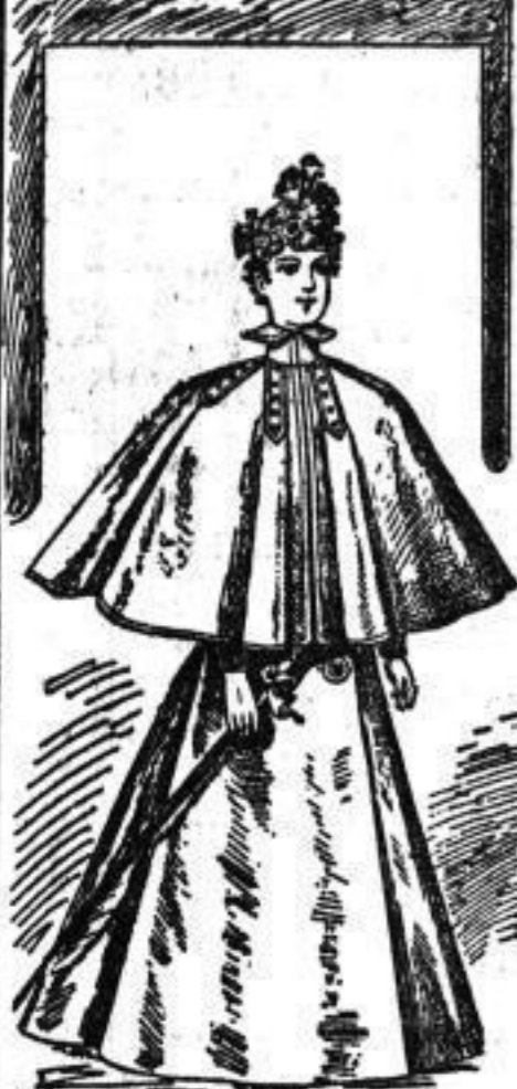
Eleganter Regenmantel mit abschmaler Feiertag in modernen Jacquardstoffe oder Chertol mit karierter Absteife Mk. 20.-- 22.-- und höher. Regenmantel mit abschmaler Feiertag von Mk. 20.-- an.