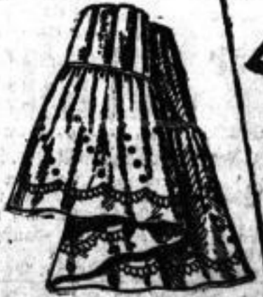
Lüster-Rock mit gezeichneten Volant Mk. 2.50.