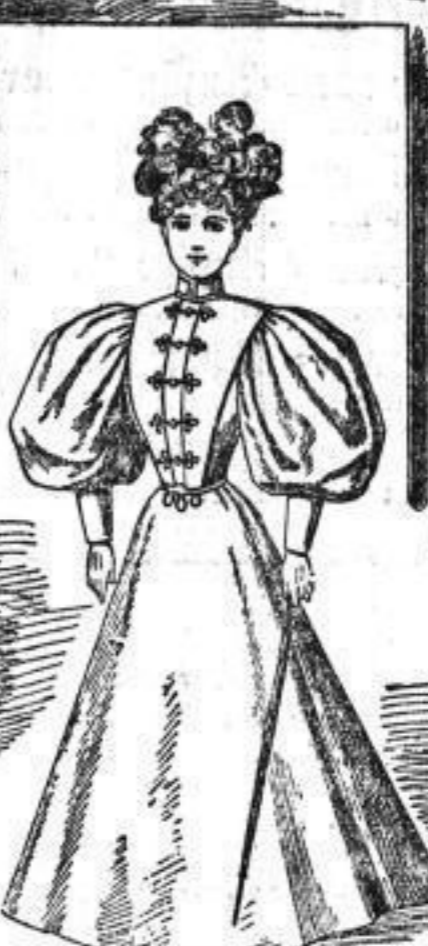
Elegantes Strassen-Kostüm aus hochwollenen modernen Fantasiestoffen Mk. 20.-- 26.-- 32.--