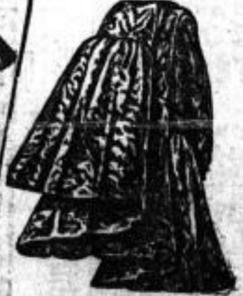
Moirée-Rock in schwarz und farbig Mk. 2.50. 3.50. 4.50.

Qualität 17, 20 cm. lang Mk. 18.-- Qualität 17, 25 cm. lang Mk. 20.-- Qualität 17, 30 cm. lang Mk. 22.-- Qualität 17, 35 cm. lang Mk. 24.-- Qualität 17, 40 cm. lang Mk. 26.-- Qualität 17, 45 cm. lang Mk. 28.-- Qualität 17, 50 cm. lang Mk. 30.-- Qualität 17, 55 cm. lang Mk. 32.-- Qualität 17, 60 cm. lang Mk. 34.-- Qualität 17, 65 cm. lang Mk. 36.-- Qualität 17, 70 cm. lang Mk. 38.-- Qualität 17, 75 cm. lang Mk. 40.-- Qualität 17, 80 cm. lang Mk. 42.-- Qualität 17, 85 cm. lang Mk. 44.-- Qualität 17, 90 cm. lang Mk. 46.-- Qualität 17, 95 cm. lang Mk. 48.-- Qualität 17, 100 cm. lang Mk. 50.--