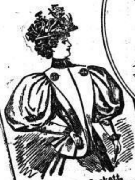
Flottes Jackett zum Ueberköpfen zu tragen. in weichen Chertol mit karierter Rück. alle Mk. 22.-- in blauem Chertol Mk. 26.--