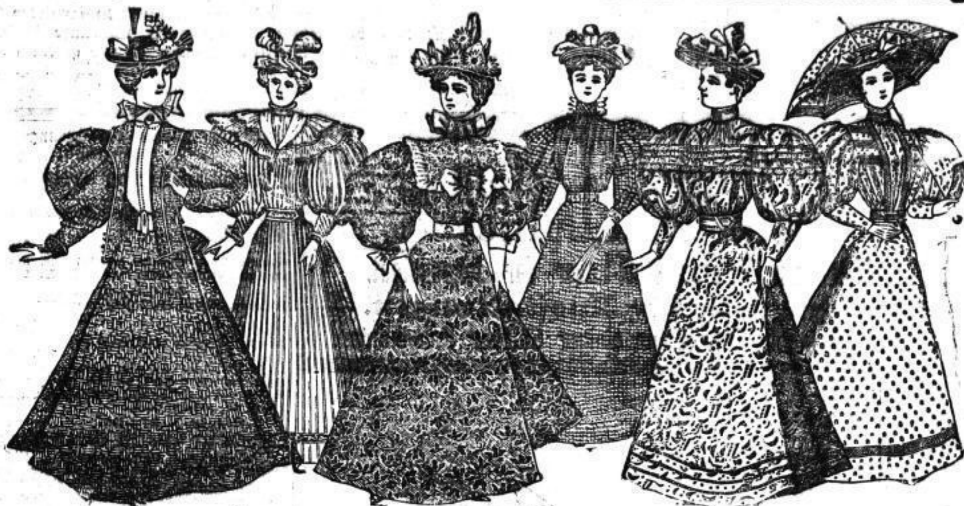
Louise, engl. Leber und Mohair, Mk. 18-30,00.

Anfertigung nach Maass in kürzester Zeit ohne Preisaufschlag.