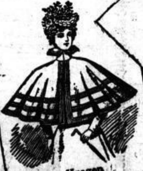
Kragen in Tuch und weichen Stoffen in jeder Preislage.