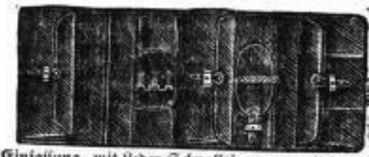
in grau Segeltuch, innen schwarz Gummistoff, inn. Tisch u. Klappen u. mit Ritzschlössern, sämtl. mit schwarz. Bänderfassung, mit Leder-Schnallriemen u. mit innerer Leder-Einrichtung, 63 cm lang, 26 1/2 cm breit, elegant, praktisch und äußerst haltbar, a Stück 3 Mk.

Dieselben in entsprechend größ. Ausführung, innen mit Schnellriemen, 58 cm lang, 26 cm breit, a Stück 1 Mk.