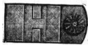
in schwarz matt Leder, innen mit gemustertem Gummistoff, mit Schwammbeutel und Taschen, mit schwarzer Bänderfassung, 43 cm lang, 22 cm br., a St. 50 Pf.

in derselben Ausführung u. Größe, innere Einrichtung, a Stück 3 Mk.