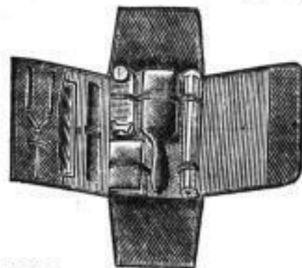
7 Theile, als Spiegel, Kamm, Zahnbürstendose, Seifendose, Pomadendose, Delflasche und Bürste

hochfeine Ausführung, vorzügliches schwarzes Leder mit bestem Lederfutter, zusammengelegt 25 cm lang, 17 cm breit, 5 cm hoch, mit doppelten Ritzschlössern. Mit vollständiger elegant. Einrichtung, 14 Theile, als Patent-Facetten-Spiegel, Schere, Schußknöpfer, Taschennmesser, Feinrasen in Lederetui, Zahnrücken in Lederetui, Kamm und Nagelbürste, a Stück 3 Mk.