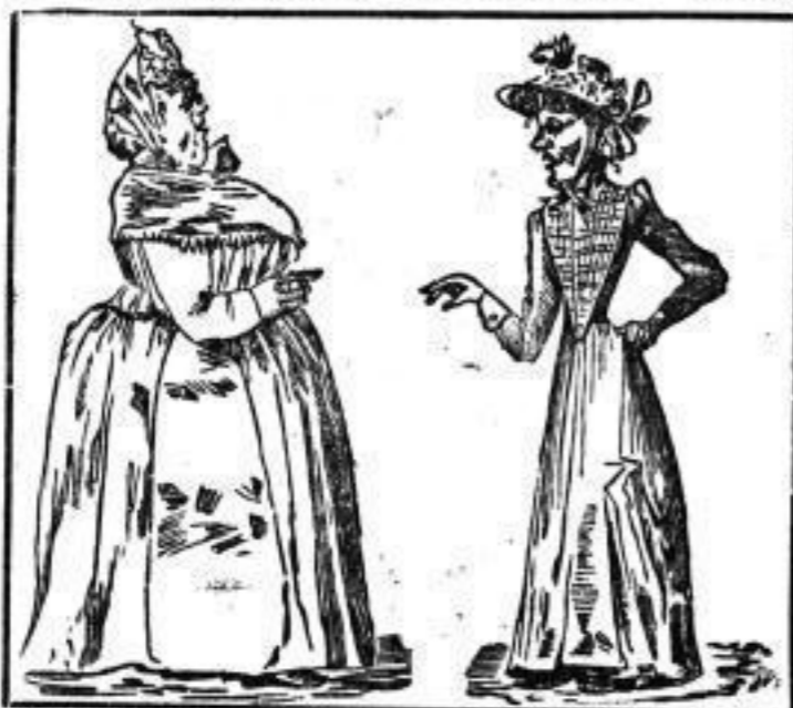
das ich meinen Weihnachtsbedarf bei