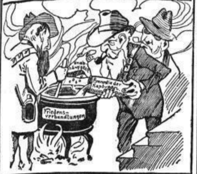
Edvard: Das dauert wieder wie lang und dann ist's noch — ob's überhaupt genießbar ist.