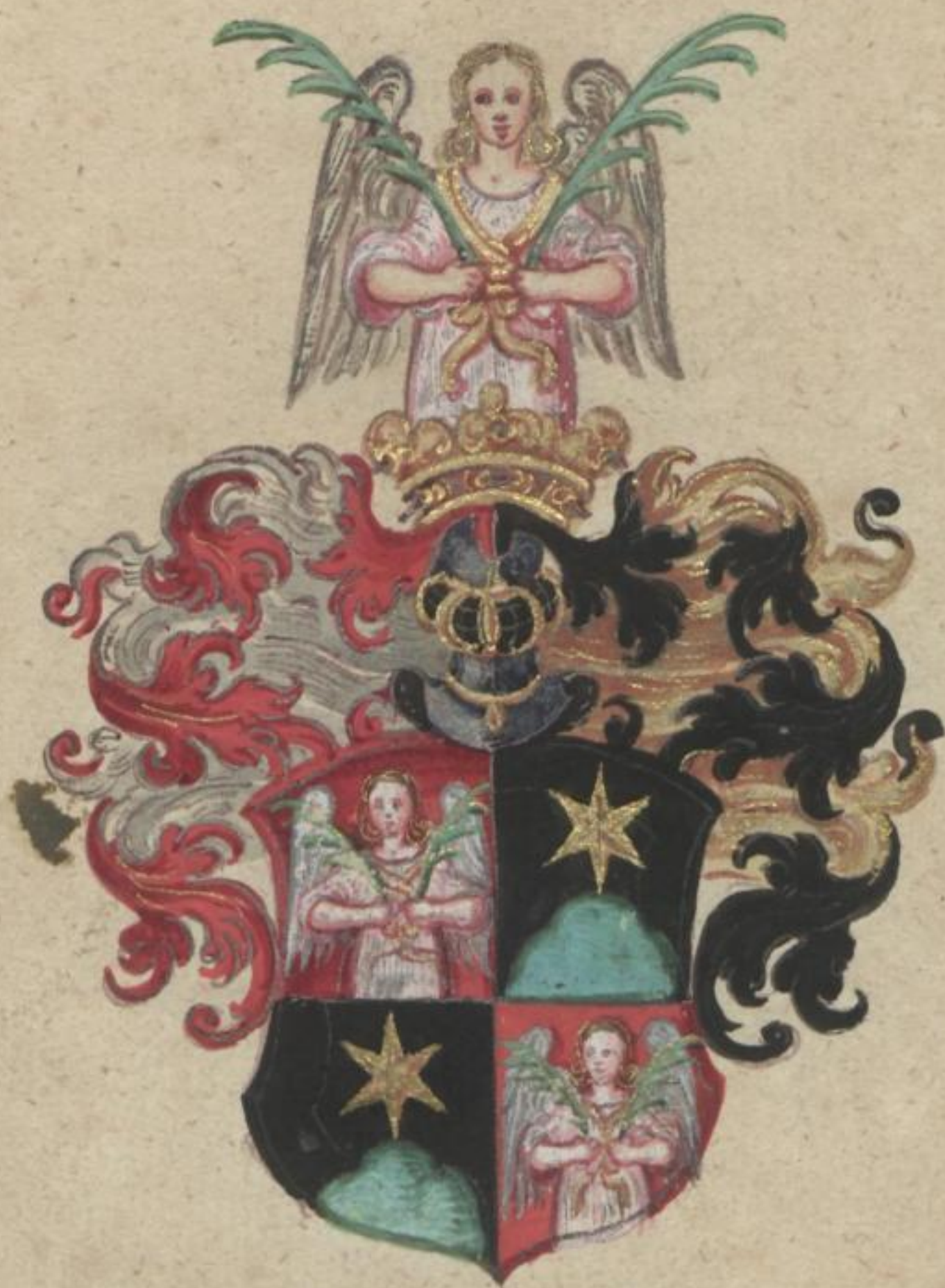
Liebt Engel von Bergsdorf.