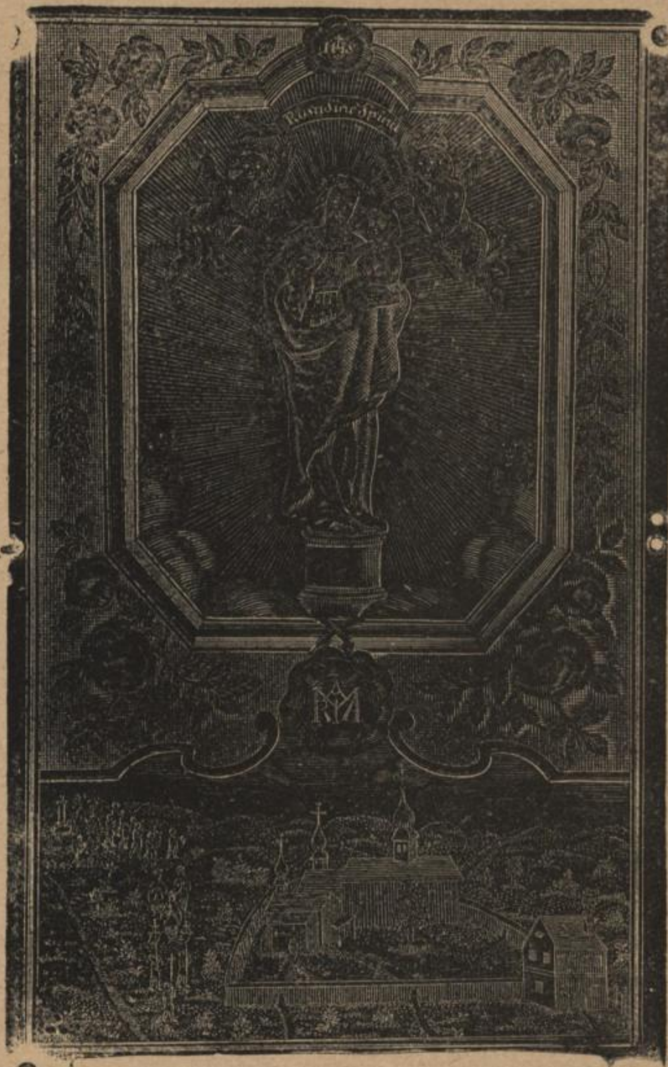
Różant w. l. 1700.