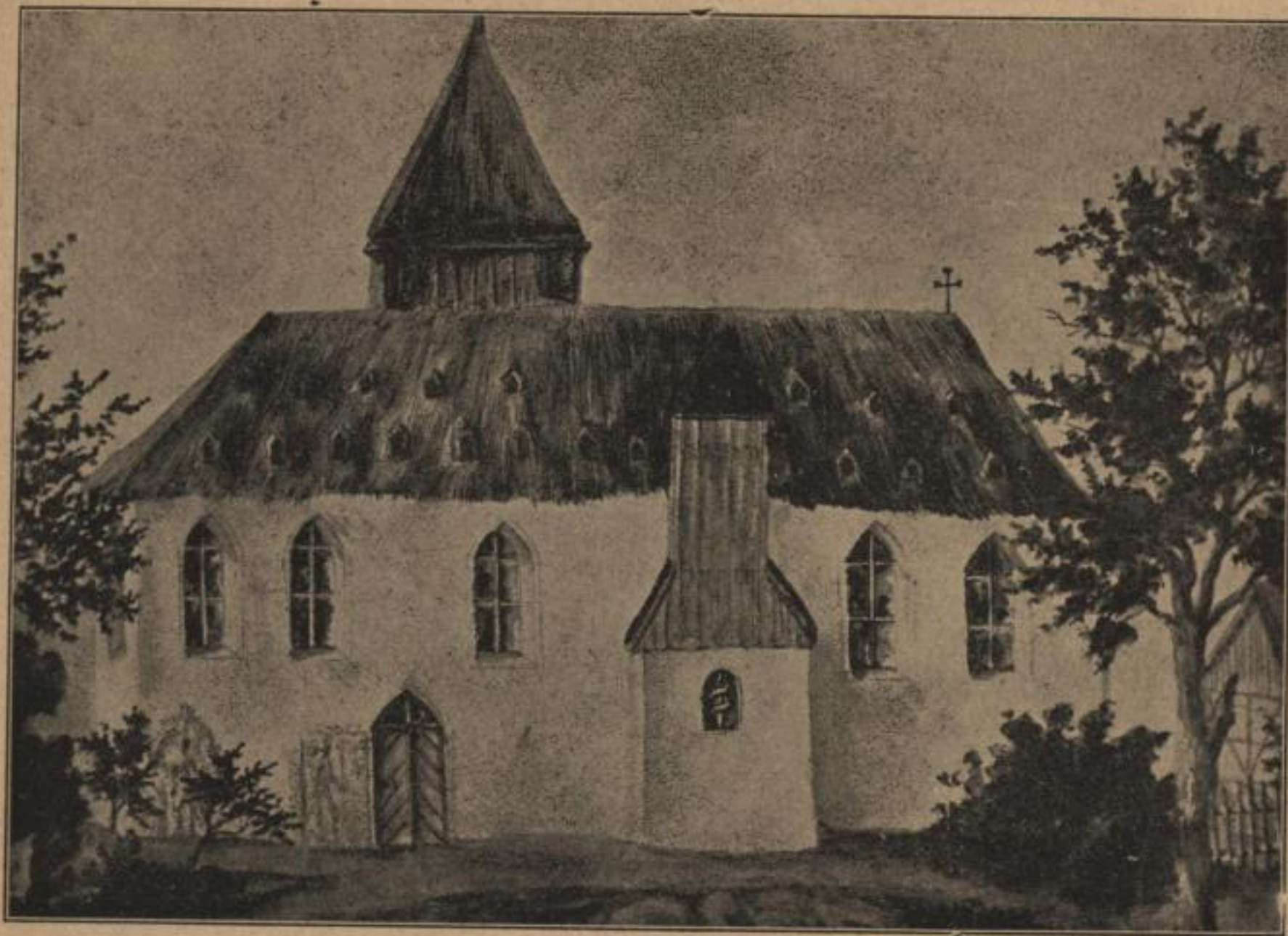
Prěnja křescánska cyrkej w Radworju, wokoło lěta 1400—1500. (Ze słomu kryta.)