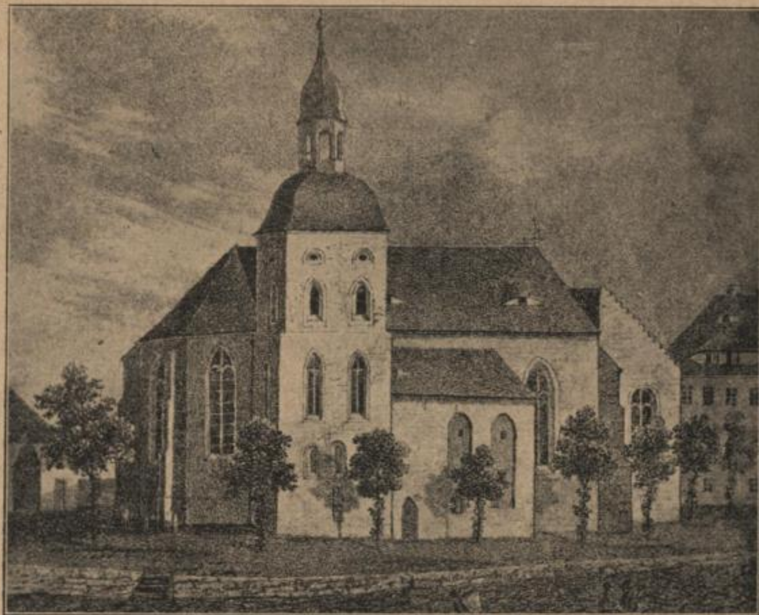
Serbska cyrkej w Budyšinje, w. l. 1850.