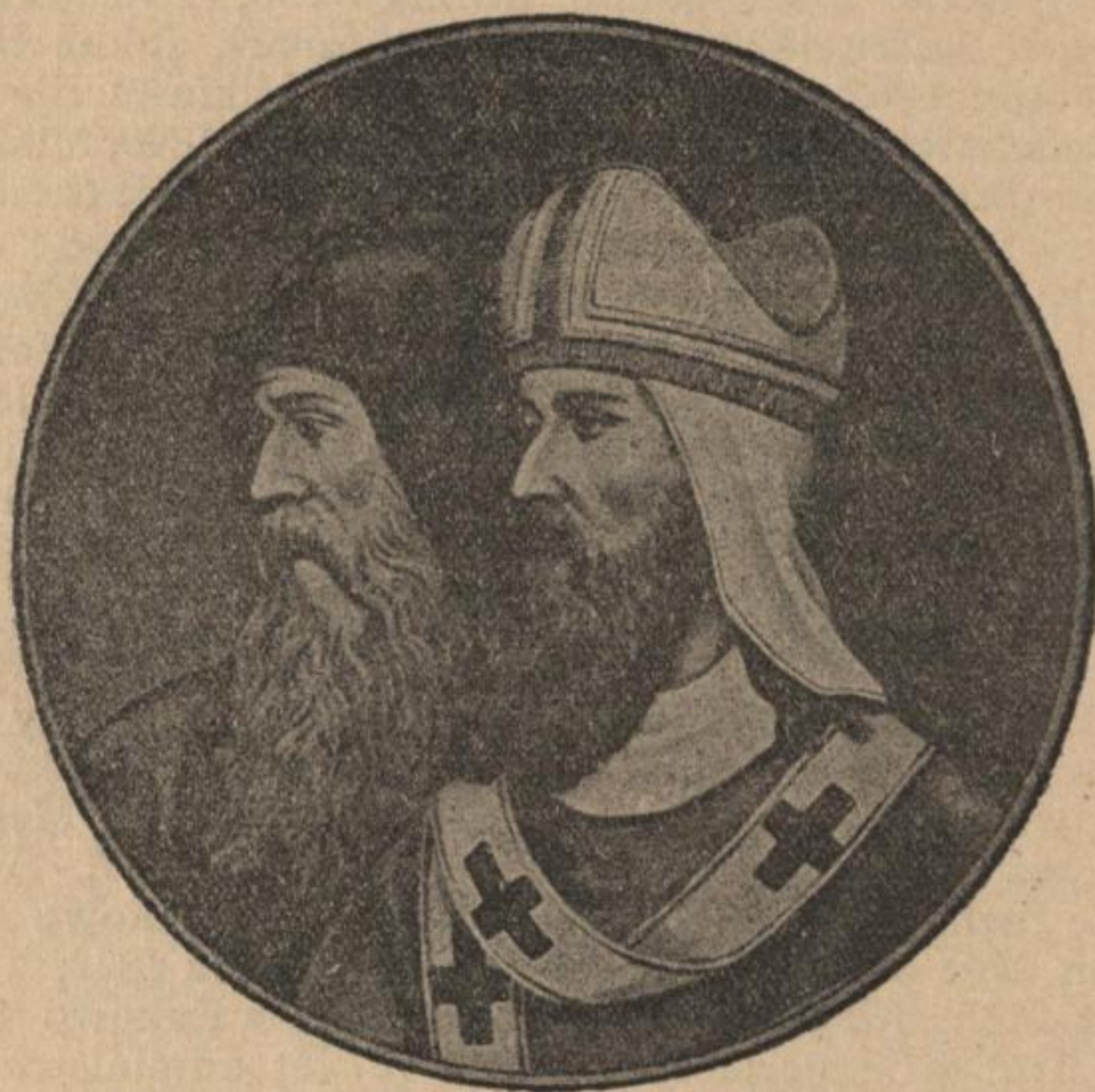
Ss. Cyrill a Method.

Biskop Löbmann (hl. str. 117) wumřě 4. 12. 1920.