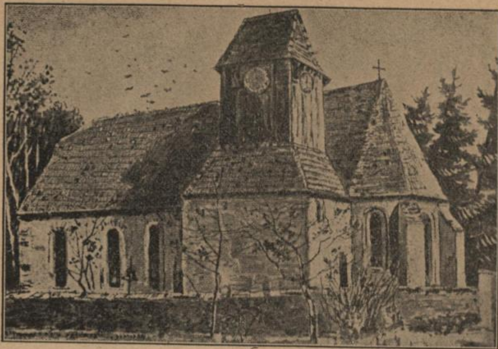
Radwoń: stara farska cyrkej, w. l. 1850.