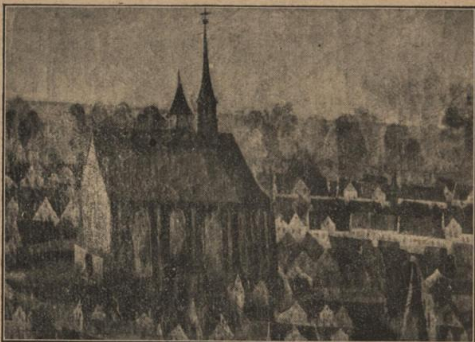
Serbska cyrkej w Budyšinje, w. l. 1600.