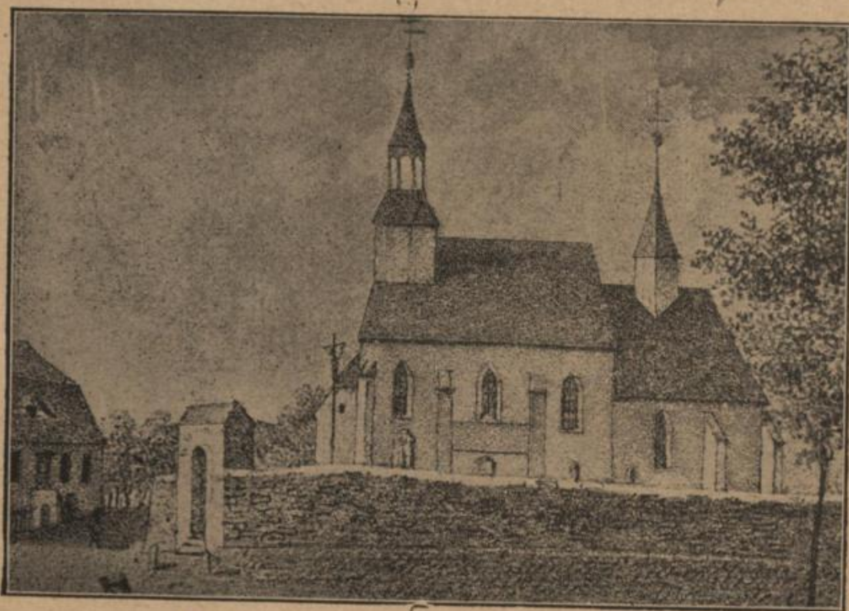
Radwoń: křižna cyrkwička, w. l. 1850.