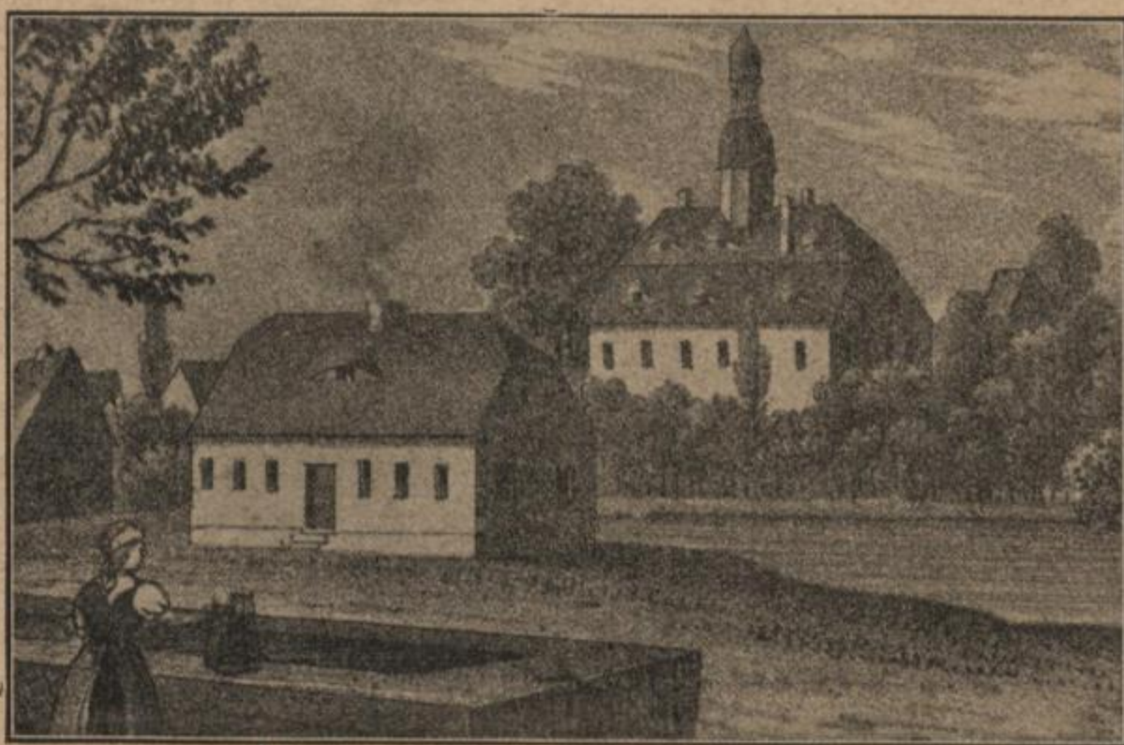
Hród (z kapalu) w Zdźěri, w. l. 1850.