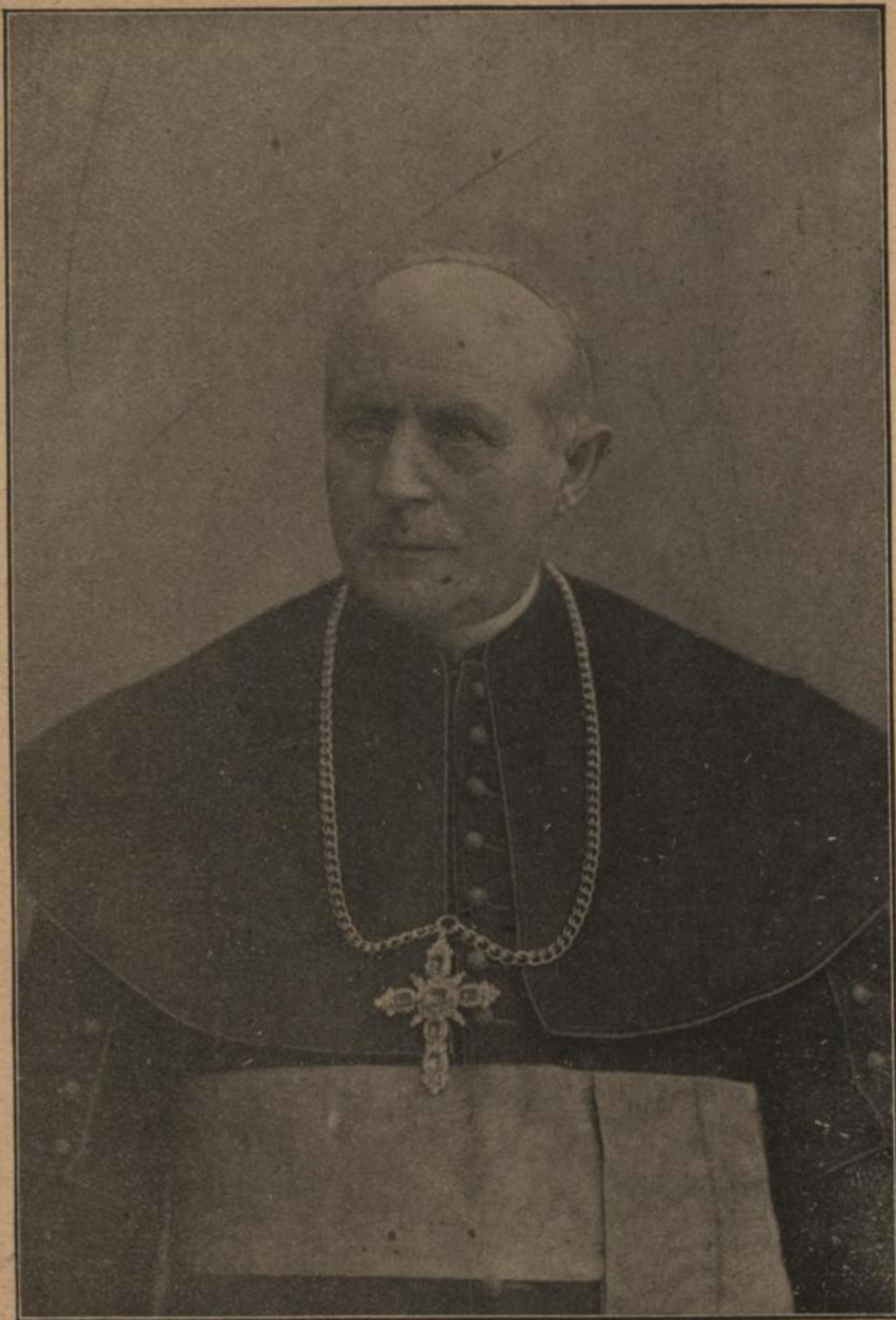
Biskop Łusčanski, † 1905.