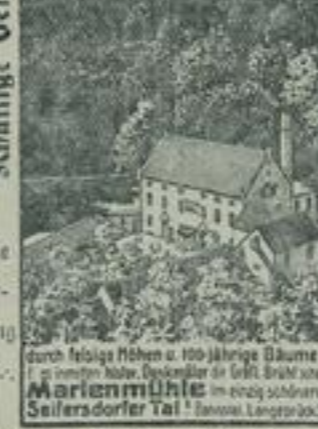
durch heilige Nöhen u. 100-jährige Bäume in unmittelb. Umgebung der Mühle Marienmühle im einzig schönsten Seifersdorfer Tal

Größere Vereine werden um vor- herige Anmeldung gebeten.