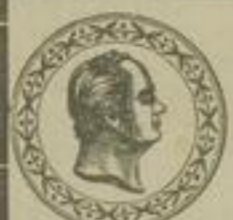
Silberne Staatsmedaille Berlin 1878.

Serviett- Seiden in div. Qual. u. Format. Chlorfrei weiss Seiden zur Emballage für polirte Holz- u. Metall-Gegenstände etc. Papier José ganz weiches Seiden, sogen. Fensterpapier. Schwed. Seiden dem in Schweden fabri- cirten an Weichheit und Haltbarkeit nicht nachstehend, nur im Preise bedeutend billiger. Imit. Pergament in naturell, weiss und farbig, bis zu Seidenstärke herab, in allen Formaten. Fantasie-Papiere , neue Dessins. Mit Mustern steht auf Wunsch zu Diensten Adolf Fiegel, Berlin. S. W. 19, Kommandantenst. 86 32478