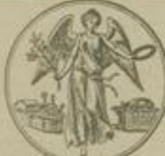
Ehren-Preis Berlin 1878.

Mechan. Werkstatt und Metallgiesserei, Cöthen in Anhalt.