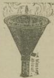
Wassersfang für Dampfauspuffrohre.

Kupferne Rohrleitungen u. Façonstücke. Compensationsrohre und Schlangen in Kupfer und Eisen.