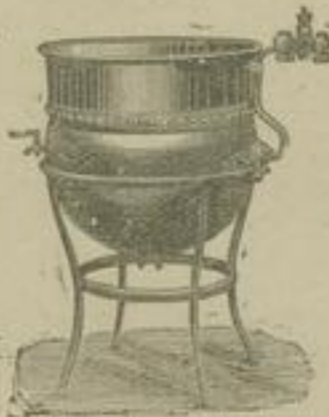
Dampf-Doppelkessel zum Leimauflösen.

für Abdampf-, Hoch- und Niederdruck mit schmiedeeisernen oder Blechröhren.