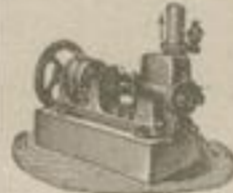
Pumpe ohne Ventil.

zum Fördern von Wasser, Laugen, Säuren, Papier- stoff etc. Druckhöhe bis zu 30 m. Arbeiten nicht durch Centrifugalkraft, sondern durch Druck.