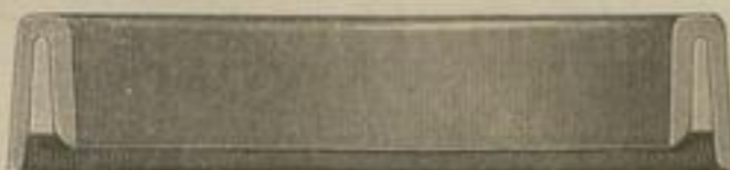
Querschnitt einer Manschette mit Gummi-Einlage.

Eigenes Fabrikat in besonderen, zweckent- sprechenden Formen aus vorzüglichstem Roh-Material (pure boss material).