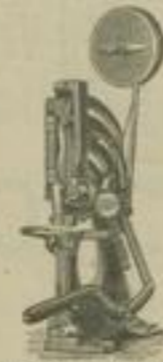
Maschine No. 5.

Draht- und Faden-Heftmaschinen jeder Art. Ledersehärfmaschinen.