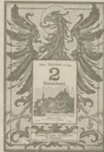
Nr. 2 mit Reichsadler.