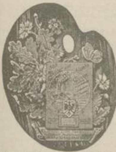
No. 1 in Form einer Palette.

erscheint für 1897 im dritten Jahrgang und zwar diesmal mit drei verschiedenen Rückwänden.