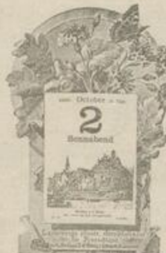
No. 3 mit Blumenarrangement.

No. 3 ist auch zum Aufstellen eingerichtet.