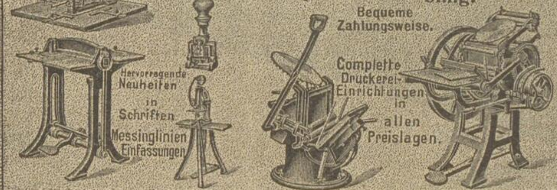
Solide fachmänn. Bedienung