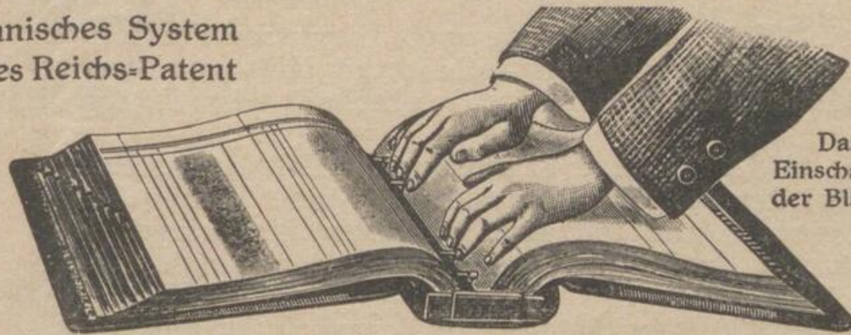
Das Einschalten der Blätter

Amerikanisches System Deutsches Reichs-Patent