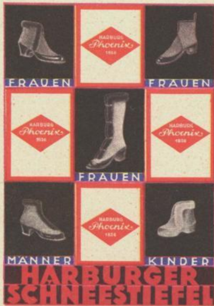
Nr. 15 „KUNEO“