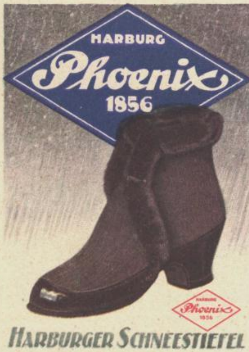
Nr. 36 „PELZBESATZ“