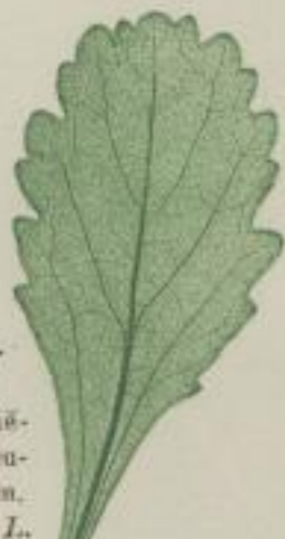
16. Weiße Wucher- blume; Chrysanthemum Leucanthemum. L.

i) spatelig; spathulatum; spatulée; en spatule.