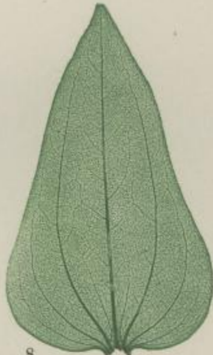
8. Bierliche Zinnia elegans. Jacq. Zinnia; Zinnia

g) keilig; keilförmig; cuneiforme; en coin.