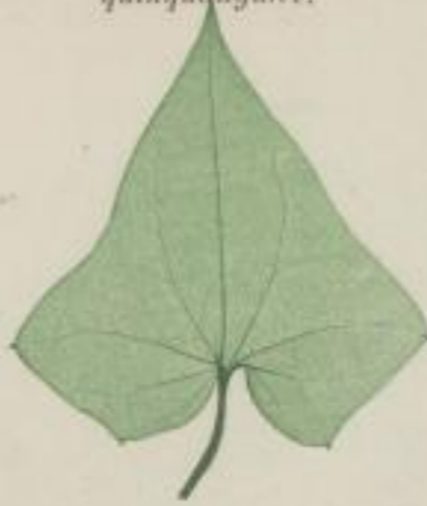
4. Berdan's Maurandie; Maurandia Barclayana. Bot. Reg.

e) fünf-eckig; quinquangulatum; quinquangulée.