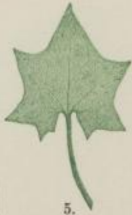
5. klimmende Mikanie; Mikania scandens Willd.

d) sieben-eckig; septangulatum; septangulée.