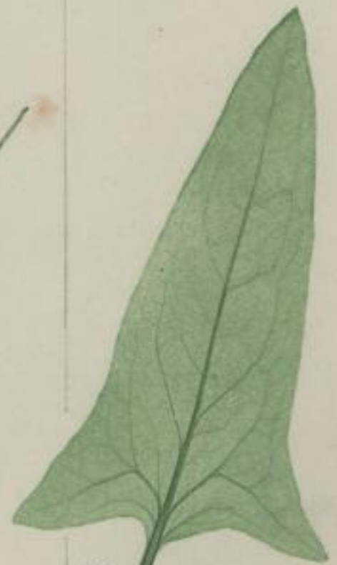
14. Winter- Spinat; Spinacia spinosa. Moench.