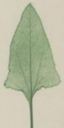
1. blasen- früchtiger Ampfer; Rumex vesicarius. L.

f) glocken- linig; campanale; campanale.