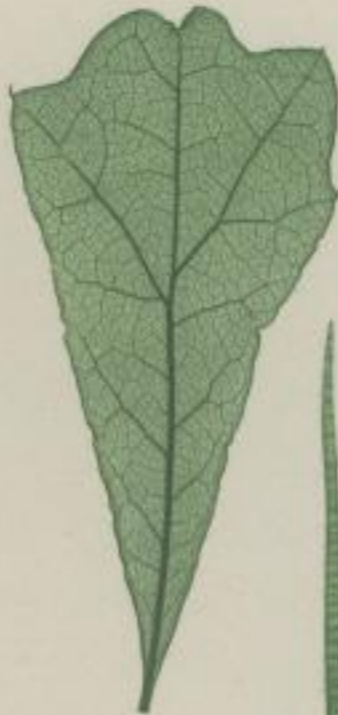
9. Sanikels Eiche; Quercus Saniculi. Michx.

g) keilig; keilförmig; cuneiforme; en coin.