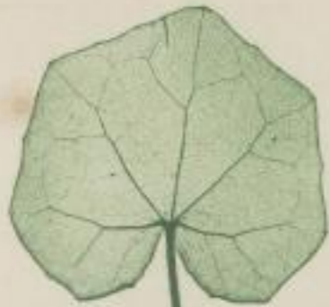
6. großes Farnblatt; Farfugium grande.

e) neun-eckig; novem-angulatum; neuf-angulée.