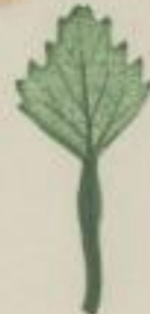
2. gemeine Wasserrauß; Trapa natans. L.

fast quadratisch; subquadratum; ovale-carrée.