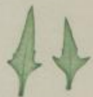
15. sitzenblühiger Erdbeer- Spinat; (oberste Blättchen). Mlum virgatum. L. (folia summa).