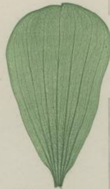
10. fuge-artige Pistie; Pistia Stratiotes, L.