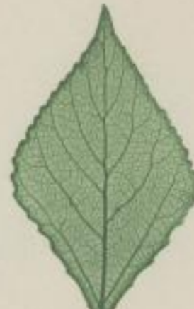
3. Pyramiden- Pappel; Populus pyramidalis, Rozier.

a) dreieckiges Blatt; triangulatum; triangulée.