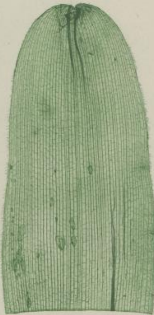
18. weißblühende Blutblume; Haemanthus albiflorus. Jacq.

k) zungig; zungenförmig; linguiforme; linguiforme.