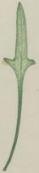
13. dreitheilige Einschuppe; Monolepis trifida. Schrad.

i) spatelig; spathulatum; spatulée; en spatule.