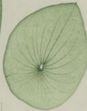
durchwachsenes Bäpchenkraut; Uvularia perfoliata. L.