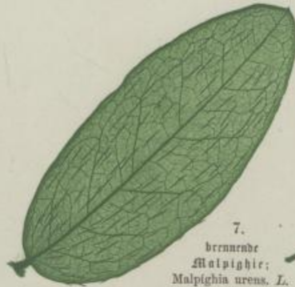
7. brennende Malpighie; Malpighia urens. L.