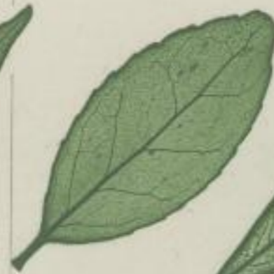
2. japanischer Spindelbaum; Evonymus japonicus. Thbg.