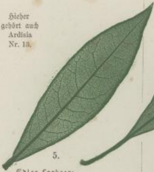
5. Edler Lorbeer; Laurus nobilis. L.