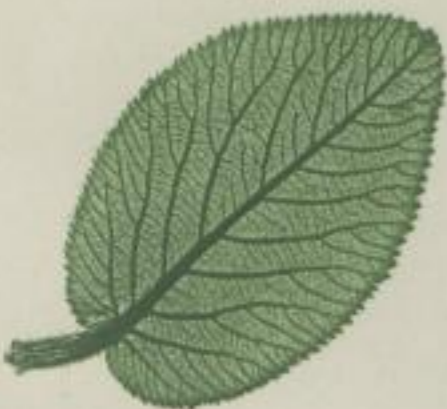
15. wolliger Schneeballenstrauch; Viburnum Lantana. L.