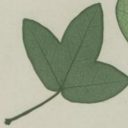
10. Ahorn von Montpellier; Acer monspessulanum. L.