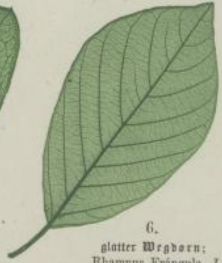
6. glatter Wegdorn; Rhamnus Frangula. L.