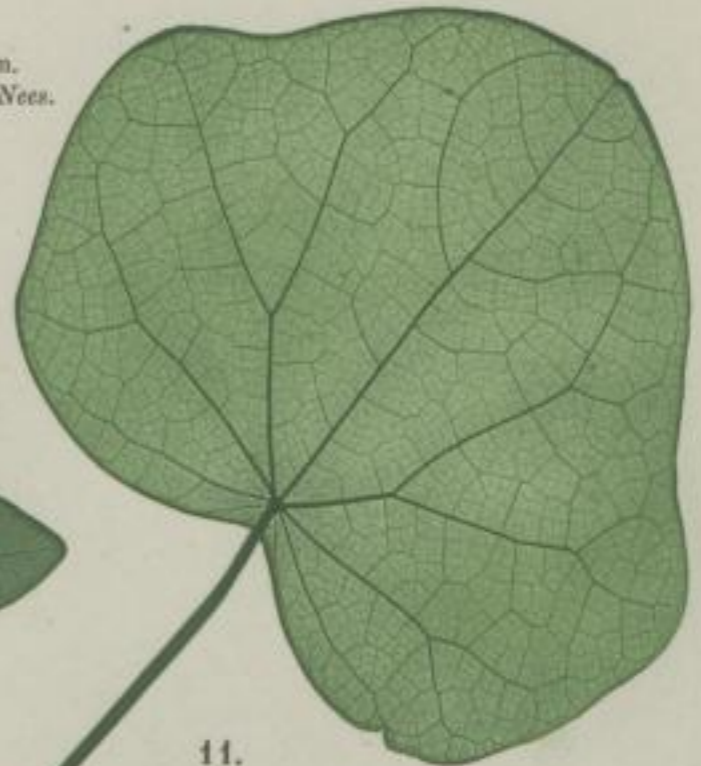
11. Canadischer Mondsaame; Menispermum canadense. L.