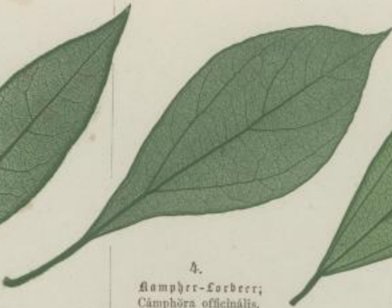
4. Kampfer-Lorbeer; Campōra officinalis. Nees.