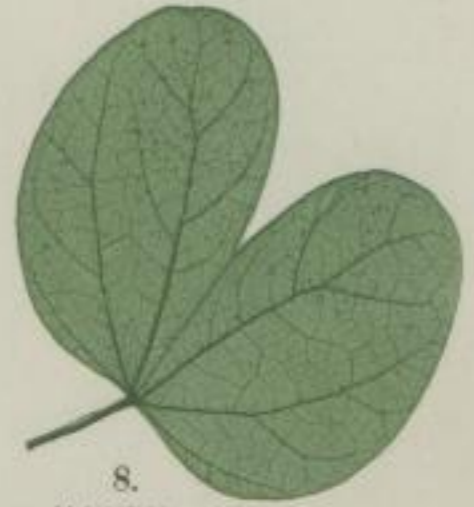
8. kleinblättrige Bauhinie; Bauhinia parviflora. Vahl.