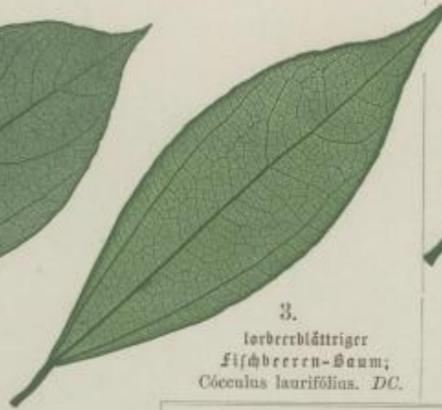
3. Lorbeerblättriger Fischbeeren-Baum; Cocculus laurifolius. DC.