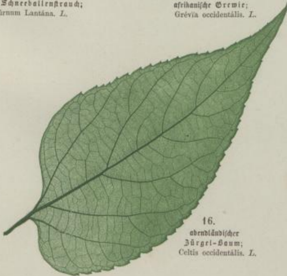
16. abendländischer Bürgel-Baum; Celtis occidentalis. L.