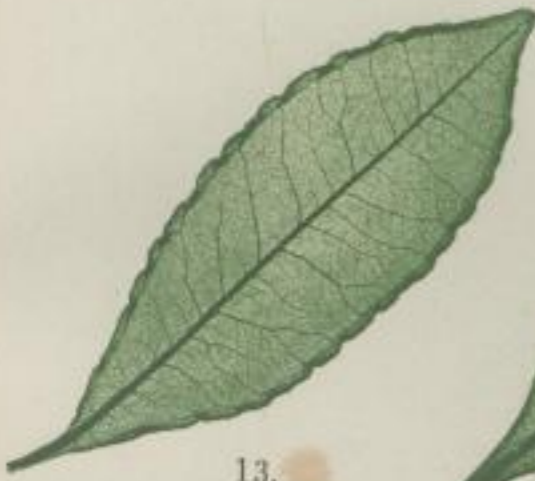
13. gekerbte Spießblume; Ardisia crenulata. Vent.

d) ganzrandig; integerrimum; oder ungezähnt; indentée;