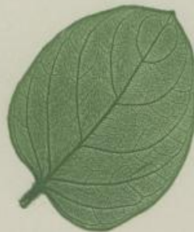
9. ceylonische Nacht-Achre; Gymnostachyum ceylanicum. Arn. et Nees.