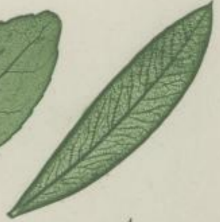
1. lanzettblättriger Prachtfaden; Callistemon lanceolatum. DC.

e) unzertheilt; indivisum; oder ganz; integrum; entière, indivisée;