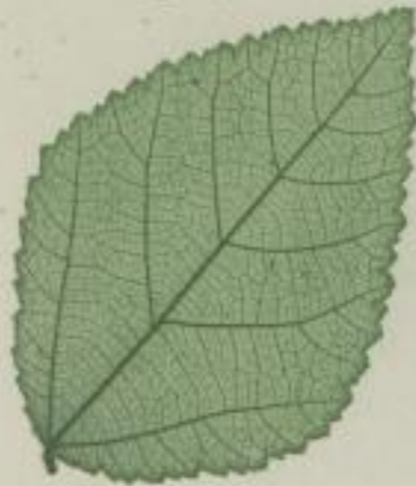
14. afrikanische Grewie; Grewia occidentalis. L.