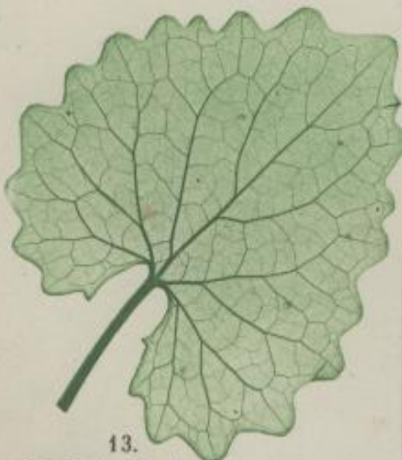
13. Anoblachs-Kraut; Sisymbrium Alliaria. Scop. Erysimum Alliaria. L.

k) sinusoidisch-geschweift; repandum margine sinusoidico; chantournée à marge sinusoidée.