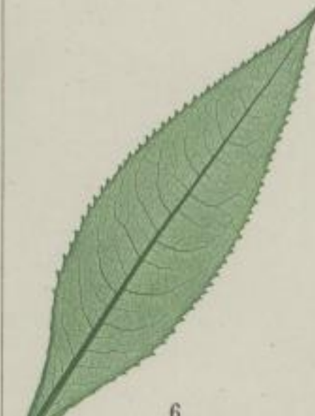
6. fuchsische Eriskraut; Baldgras. Senecio Fuchsii. Gmel.

e) sägeartig-gezähnt; serrato-dentatum; dentée en scie.