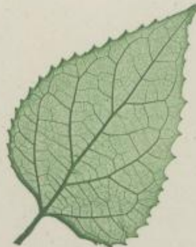
2. Bunge's Loosbaum; Clerodendron Bungei. Steud.

a) feingezähnt; gezähnet; denticulatum; dentelée; denticulée;