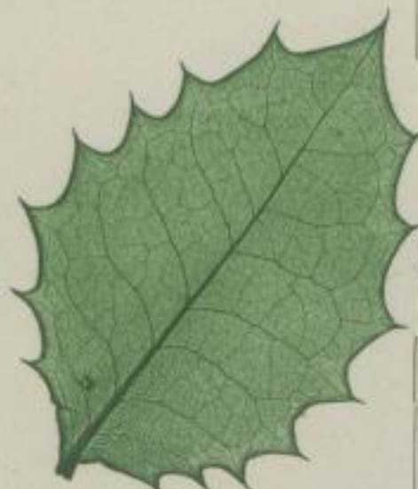
11. sechsiges Stachelkraut; Ilex Aquifolium. L. variegata.

2) mit Dornspitzen; dentibus spinoscentibus; aux dents spinoscentes.