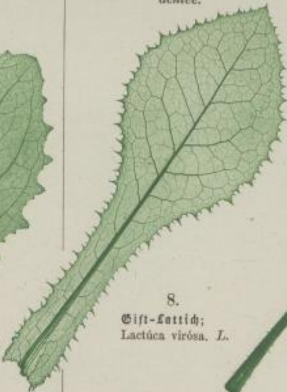
8. Gift-Lattich; Lactuca virosa. L.

g) tief und ungleich gezähnt; profunde ac inaequaliter dentatum; profondément et inégalement dentée.