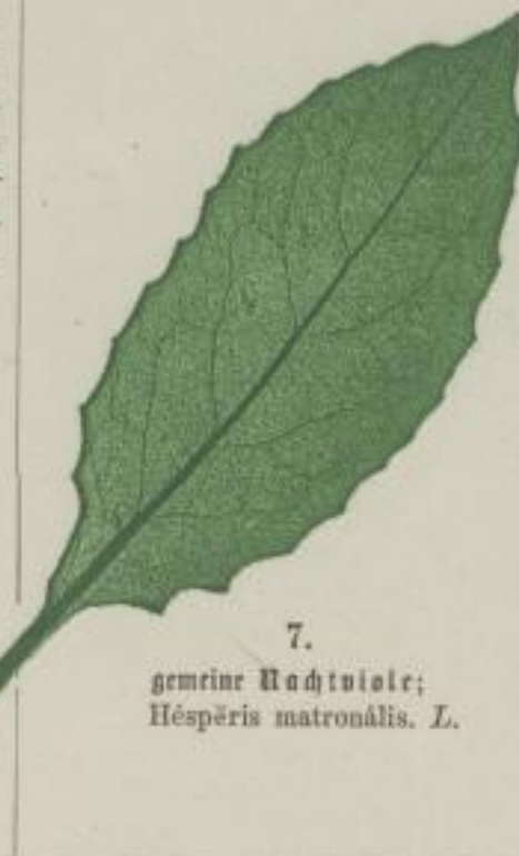
7. gemeine Nachtsie;. Hesperis matronalis. L.

f) leicht-gezähnt; dentibus minus prominentibus; à dents peu saillantes.