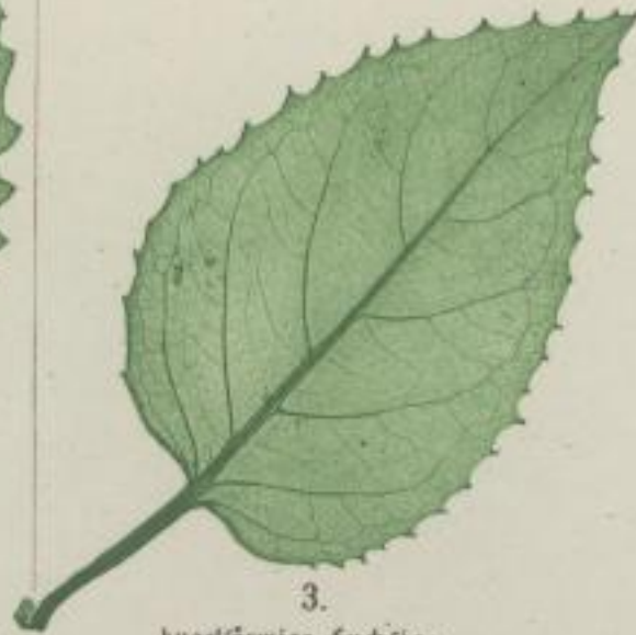
3. kugelförmige Fuchsie; Fuchsia globosa. Lindl.

1) ohne Spitzen; sine mucronibus; sans mucrones.