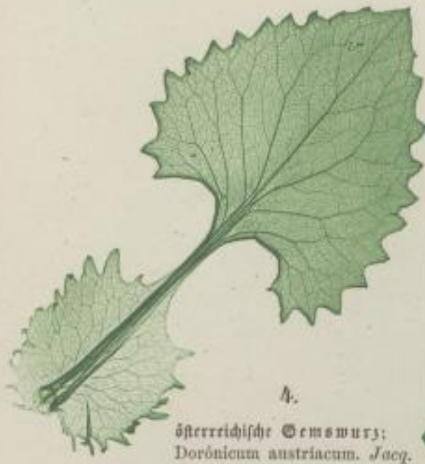
4. österreichische Gamswurz; Doronicum austriacum. Jacq.

e) groß- oder grob-gezähnt. grosse dentatum; grossièrement dentée.