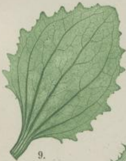
9. bunte Gaudier-Blume; Mimulus quinquevulnerus. hort. gelb. (hybrid.)

h) doppelt-gezähnt; duplicato-dentatum; deux fois dentée.