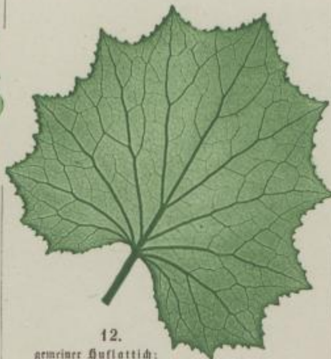
12. gemeiner Huflattich; Tussilago Färvara. L. var.

i) buchtig-gezähnt; sinuato-dentatum; dentée en sinus. 3) und zugleich gezähnet; ac simul denticulatum; et à la fois dentelée.