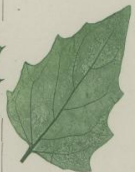
10. Scharb-Grasfuß; siebenjährlicher Gänsefuß; Chenopodium hybridum. L.

1) ohne Spitzen; sine mucronibus; sans mucrones.