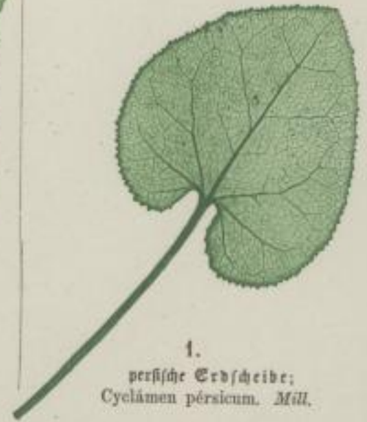
1. persische Erdscheibe; Cyclamen persicum. Mill.

a) feingezähnt; gezähnet; denticulatum; dentelée; denticulée;