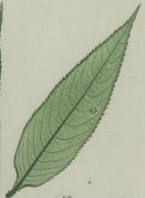
12. drüsig Springsame; Impatiens glandulifera. Arn.