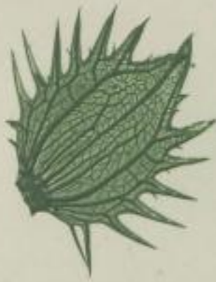
11. weiche Särenklau; Acanthus mollis. L. (Deckblatt; bractea).

g) eingeschnitten-gesägt; inciso-serratum; serrée à incisions.