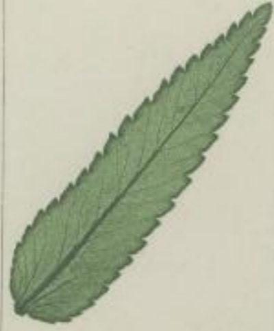
5. zottiger Hahnenkamm oder Klappertopf; Rhinanthus Alectorolophus. Pollich.

e) gleich-gesägt; æqualiter serratum; serrée à dents égales.