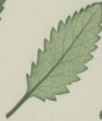
3. aufrechte Cercodie; Cercodia erecta. Murr.

a) scharf-gesägt; argute serratum; serrée à dents aiguës.