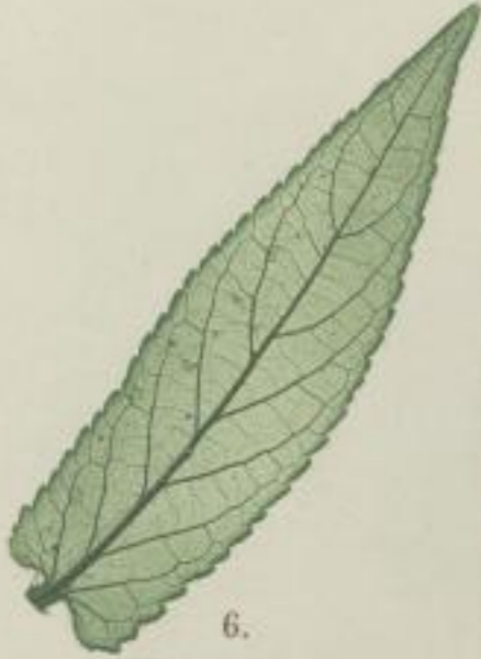
6. Sumpf-Bies; Kob-Nessel; Stachys palustris. L.

d) stumpf-gesägt; obtuse serratum; serrée à dents obtuses.