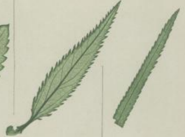
2. virginischer Chrenpreis; Veronica virginica. L.

a) scharf-gesägt; argute serratum; serrée à dents aiguës.