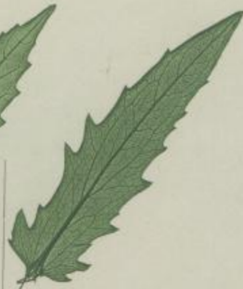
8. gemeine Flachblume; Centaurea Jacqea. L.