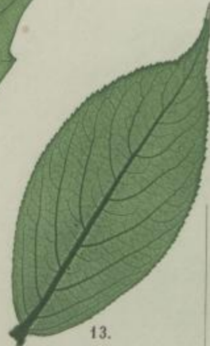
13. liebliche Weigelle; Weigelia amabilis. Planch.