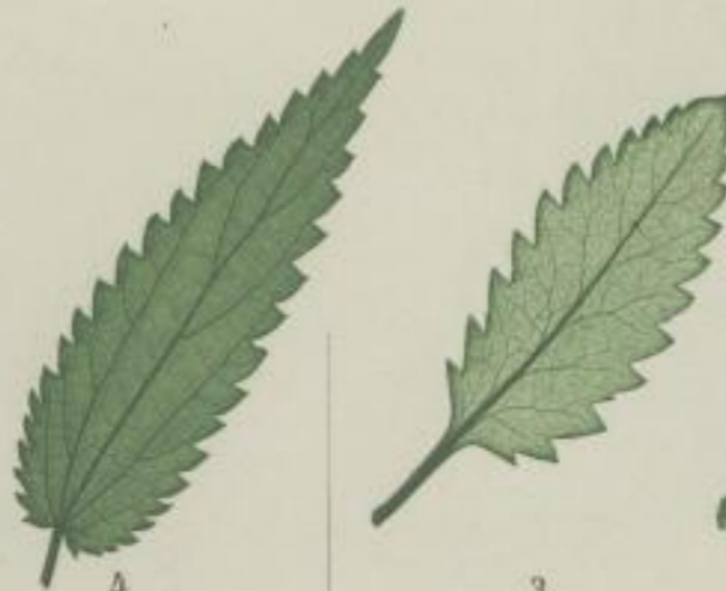
4. zweihäufige Nessel; Urtica dioica. L.

b) spitz-gesägt; acule serratum; serrée à dents aiguës.