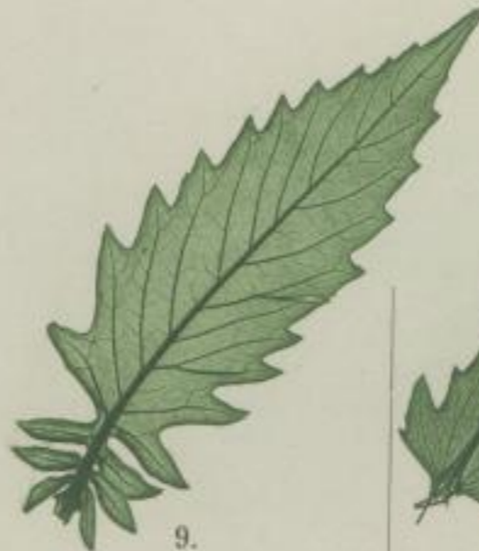
9. gemeiner Wolfsfuß; Lycopus europæus. L.