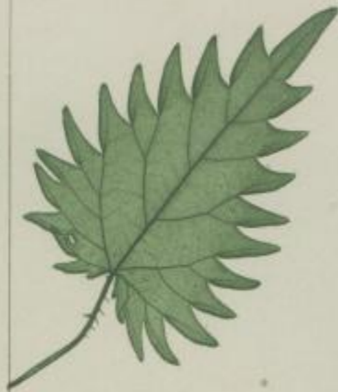
10. kugel-ährlige Nessel; Pillen-tragende Nessel; Urtica pilulifera. L.

f) ungleich-gesägt; inaequaliter serratum; inégalement serrée.