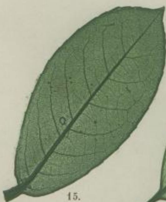
15. Airsch-Lorbeer; Prunus Laurocerasus. L.

k) leicht-gesägt; minus profunde serratum; faiblement serrée; serrée.