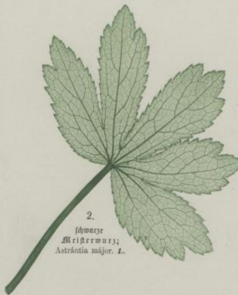
2. schwarze Meißerwurz; Astrantia májor . L.