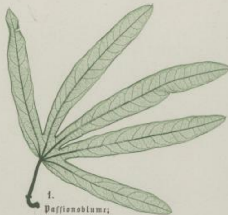
1. Passionsblume; Passiflora linearis . ?