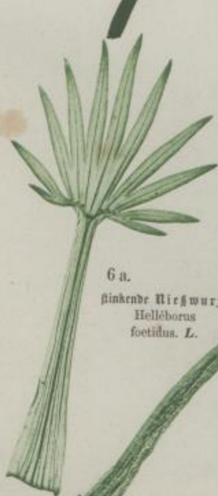
6 a. sinkende Nießwurz; Helleborus foetidus . L.