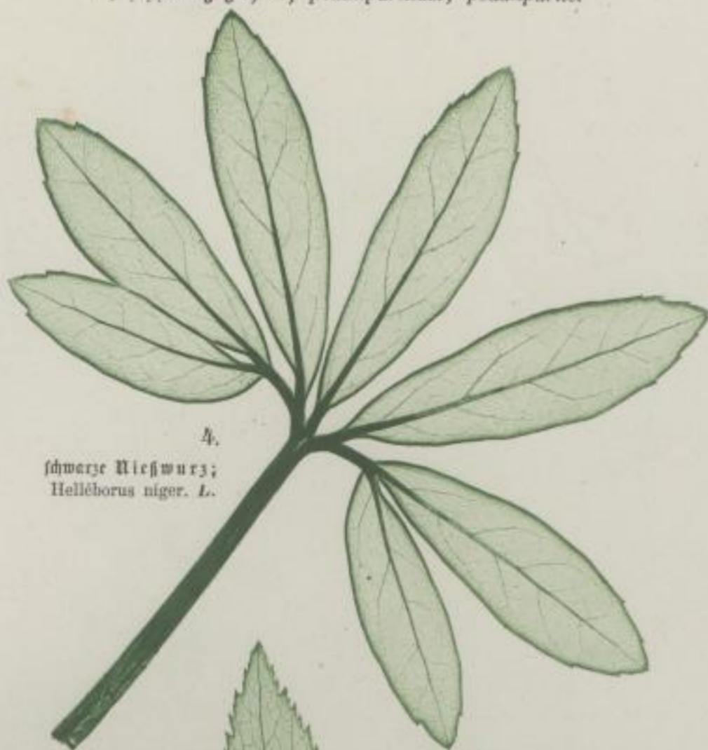
4. schwarze Nießwurz; Helleborus niger . L.

b) handförmig-getheilt; palmatipartitum; palmatipartie.