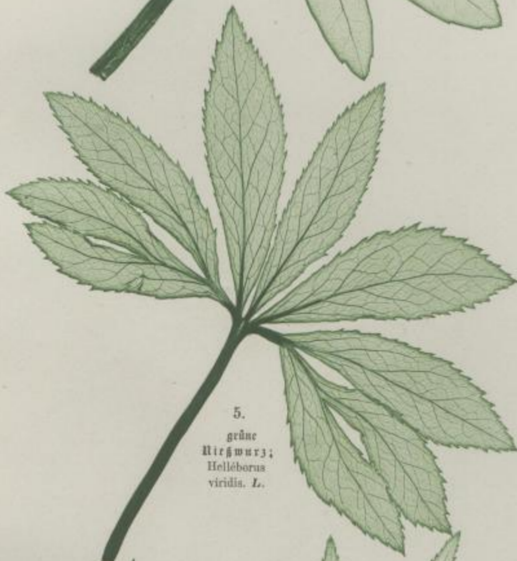
5. grüne Nießwurz; Helleborus viridis . L.