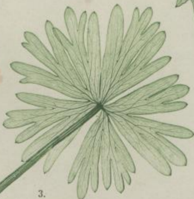
3. ferrablühiger Winterling; Eranthis hiemalis . Salisb.