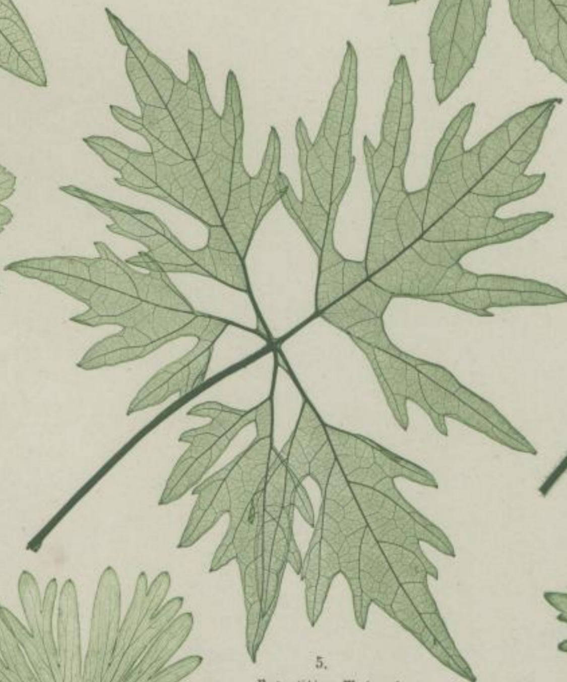
5. Petersilien-Weinrebe, Abart des Eutzel; Vitis laciniosa . L.