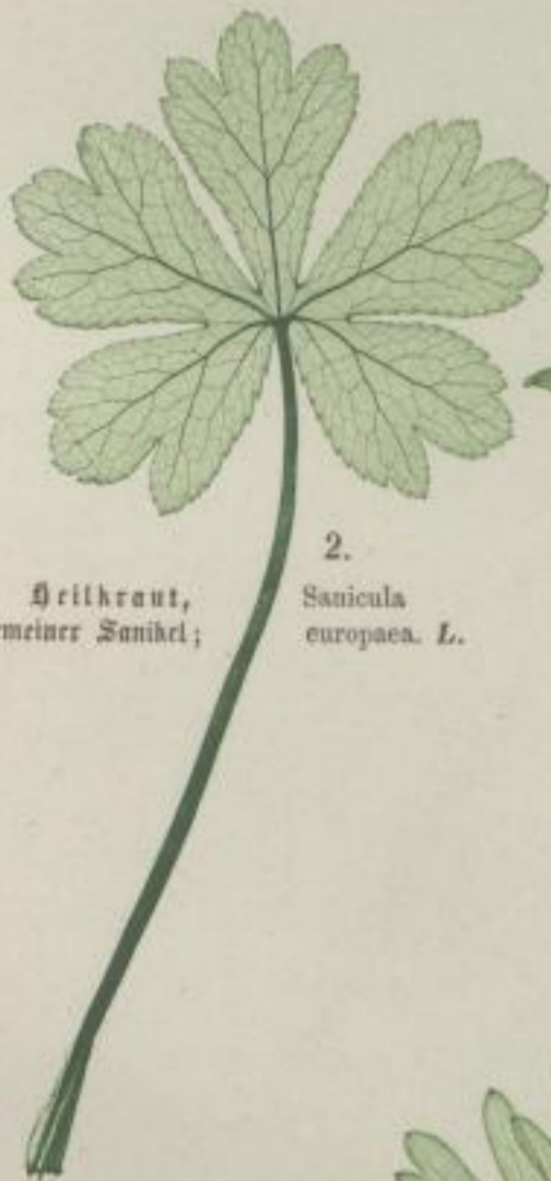
2. Heilkraut, gemeiner Sanikel; Sanicula europaea . L.