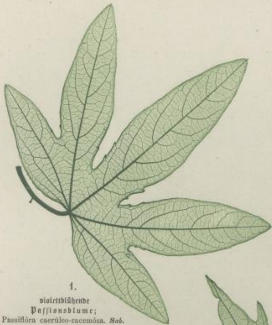
1. violettblühende Passionsblume; Passiflora caeruleo-racemosa . Sab.

handförmig-getheilt; palmatipartitum; palmatipartie.