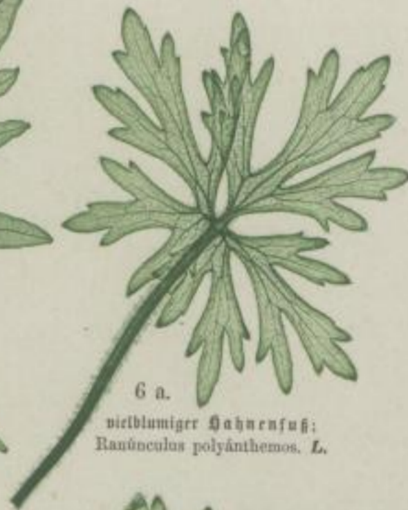
6 a. vielblumiger Hahnenfuß; Ranunculus polyanthemos . L.