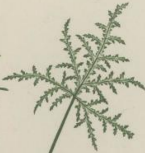
3. Hirsch-Pelargonium; Pelargonium roseum filicifol.