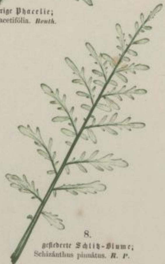
8. gestreute Schlich-Blume; Schizanthus pinnatus . R. P.