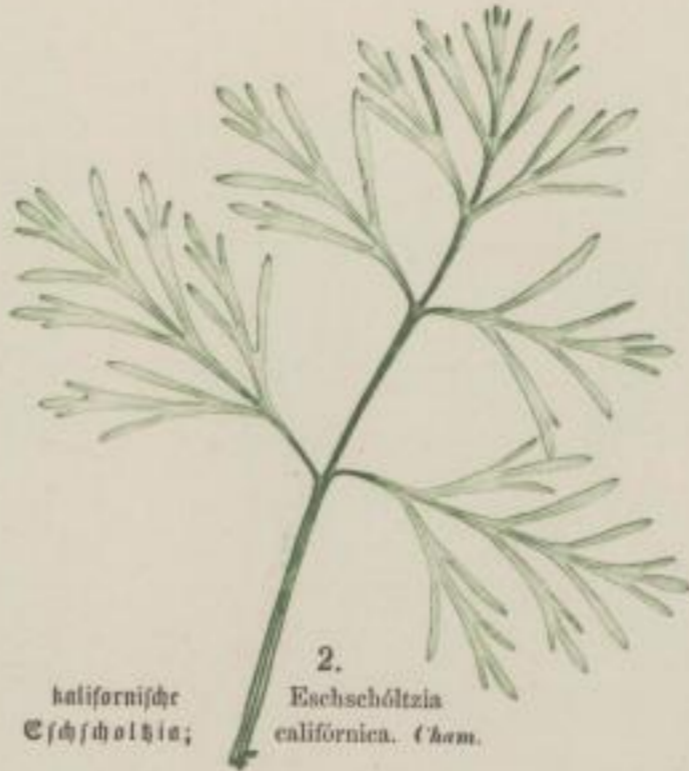
2. kalifornische Eichschölztia; Eichschölztia californica . Cham.