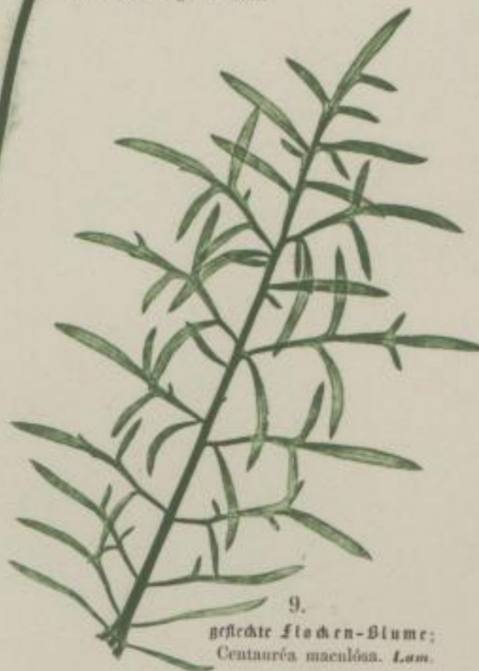
9. gestreute Fischen-Blume; Centaurea maculosa . Lam.