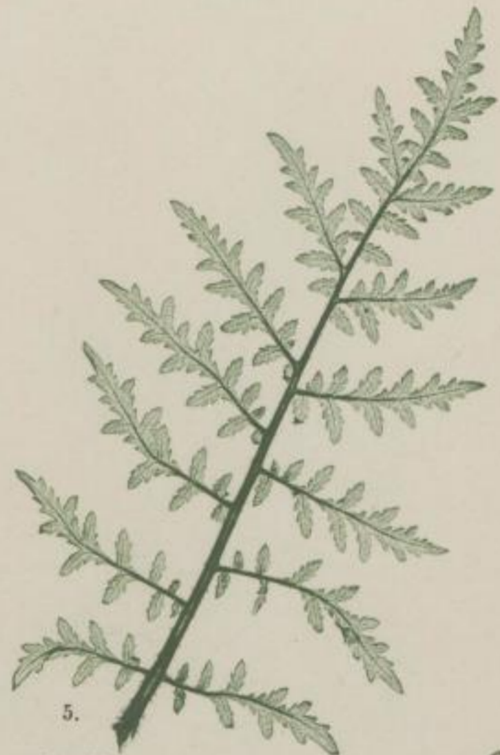
5. rausfarblättrige Phacelia; Phacelia tanacetifolia . Benth.