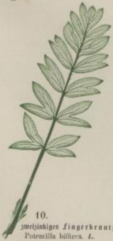
10. zweyhohiges Fingerkraut; Potentilla biflora . L.