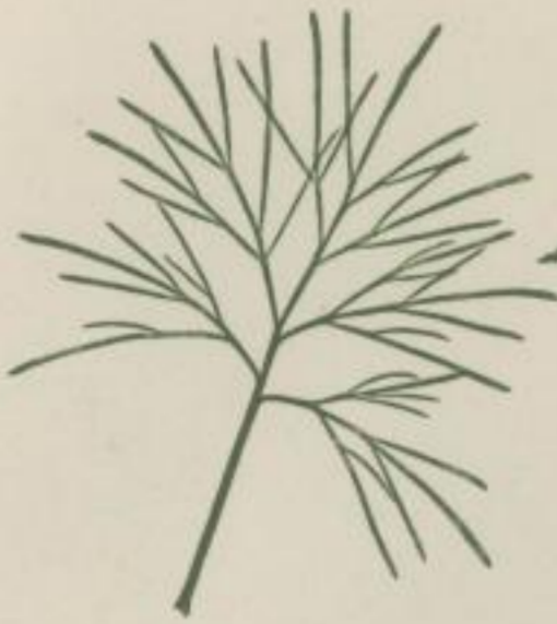
4. Stabwurz-Seisfuß; Artemisia Abrotanum . L.