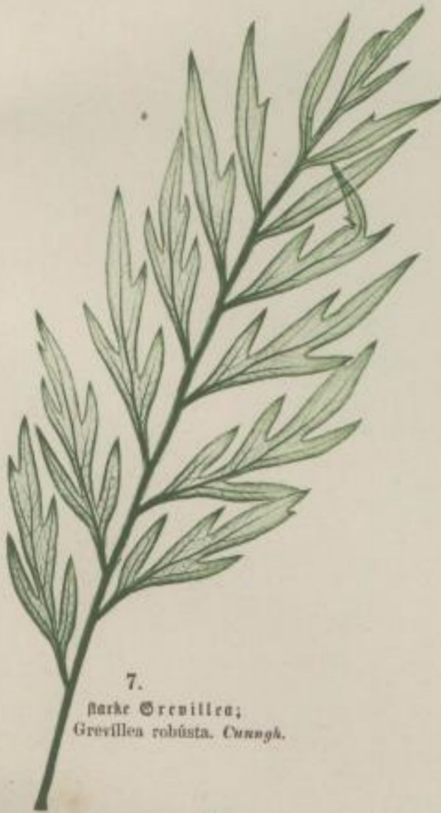
7. starke Grevillea; Grevillea robusta . Cunng.