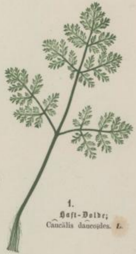
1. Haft-Daldr; Cnicus lanceolatus . L.