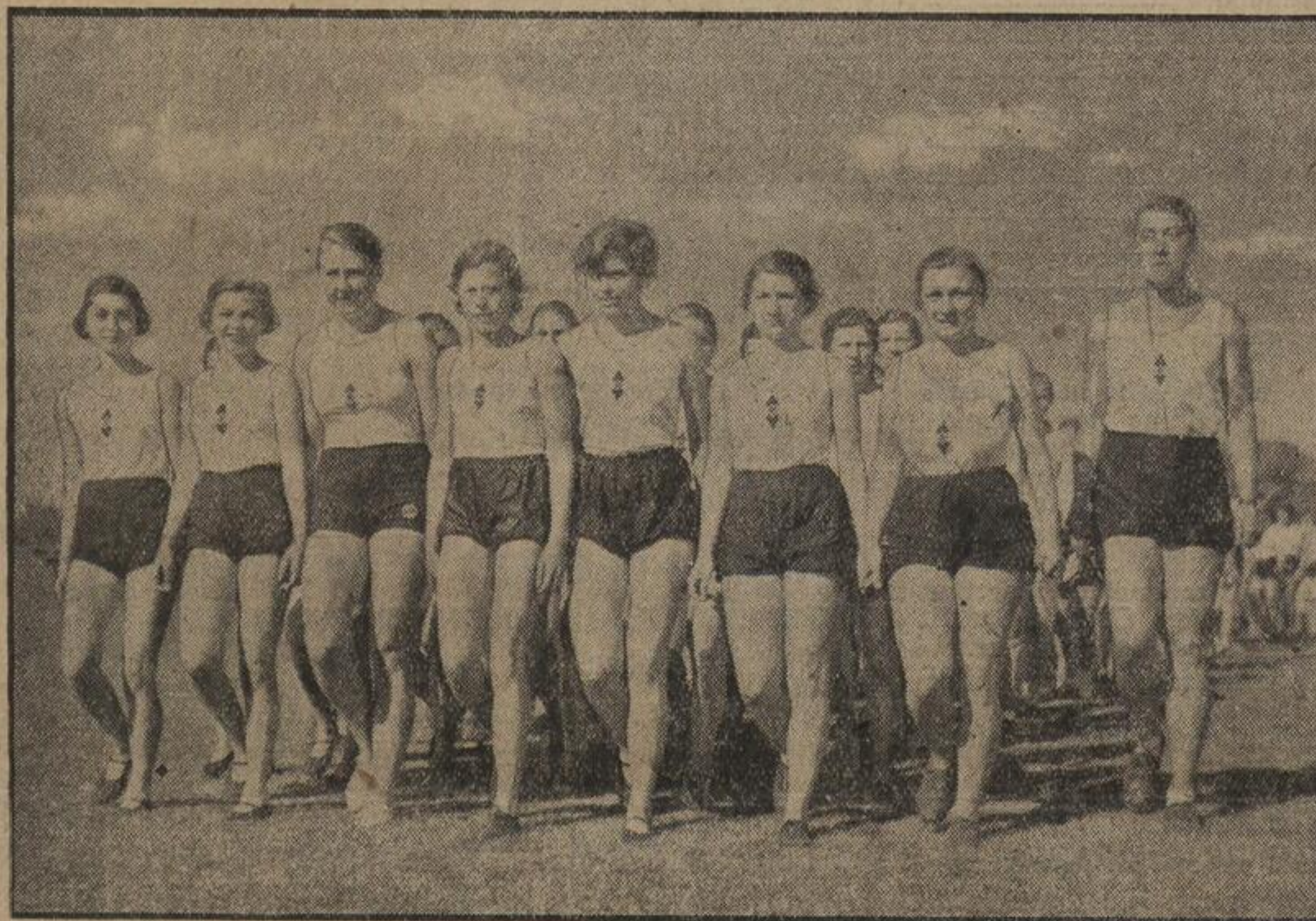
Die Reichs-Sportwettkämpfe der deutschen Jugend. Weltbild (M). Die Reichs-Sportwettkämpfe der deutschen Jugend werden für die Jungmädler und die Pimpfe am Wochenende ausgetragen. Der VbM und die HJ werden acht Tage später Proben ihres sportlichen Könnens ablegen.