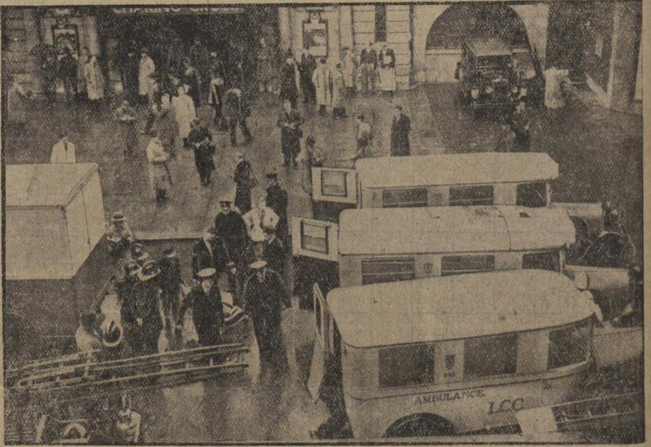
Das U-Bahnunglück in London. Weltbild (M). Zwei vollbesetzte U-Bahnzüge stießen auf dem Charing-Cross-Bahnhof in London zusammen. Unser Bild zeigt den Abtransport der Verunglückten kurz nach dem Zusammenstoß.