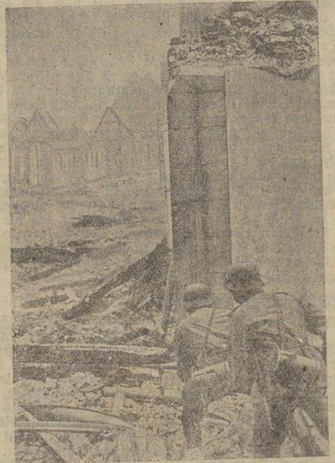
Vom Kampf an der Saarfront. Nach dem Vorstoß an der Saarfront durchstreifen Patrouillen eine eroberte französische Grenzstadt, die unter dem Feuer stark gelitten hat. — W. Jäger-Scherl-Wagenborg (W.).

Gegen die Wertung des Spieles wurde vom Bannschwart wegen Mißspielen unberechtigter Spieler Einspruch erhoben.