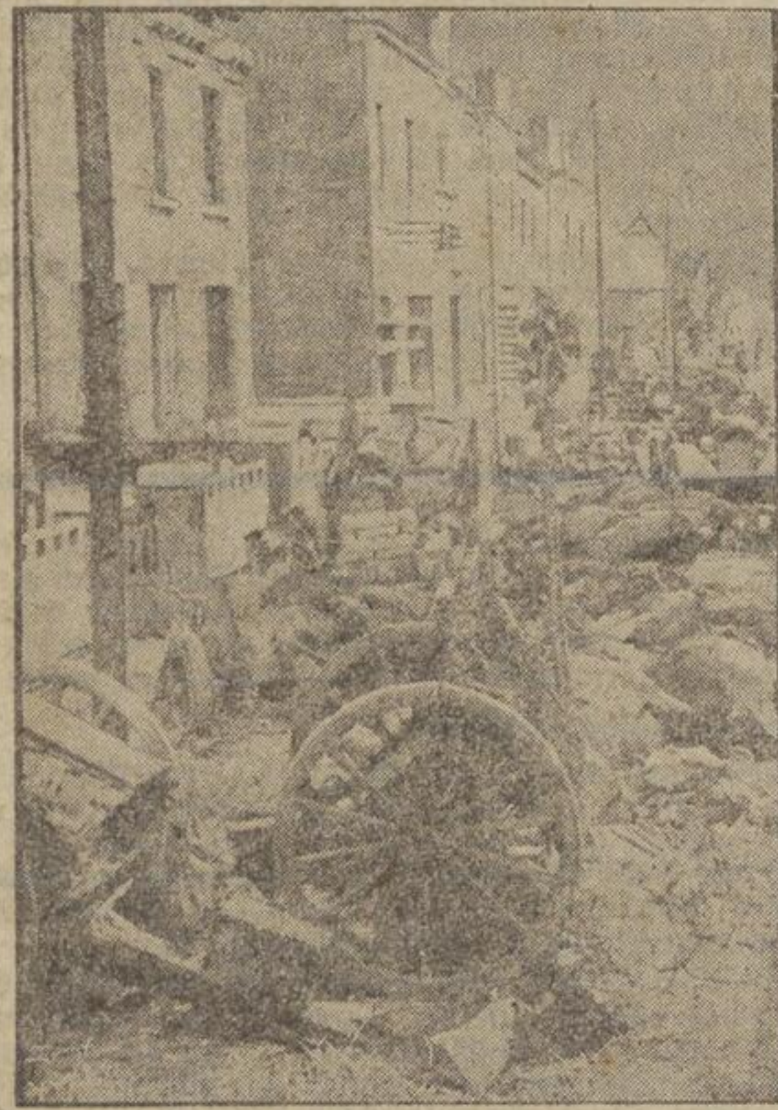
Die Straße des Rindzuges. Note Pferde, zerstörte Gefährte kennzeichnen den Rindzug der Franzosen.