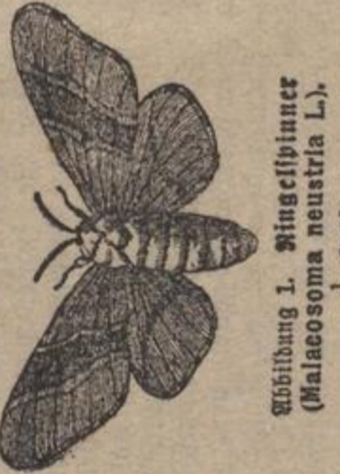
Abbildung 1. Ringelspinner (Malacosoma neustria L.).

Ein gefährlicher Feind unserer Obstgehäule ist die Raupe des Ringelspinners (Malacosoma neustria), eines zur Familie der Schmetterlinge gehörenden Falters.