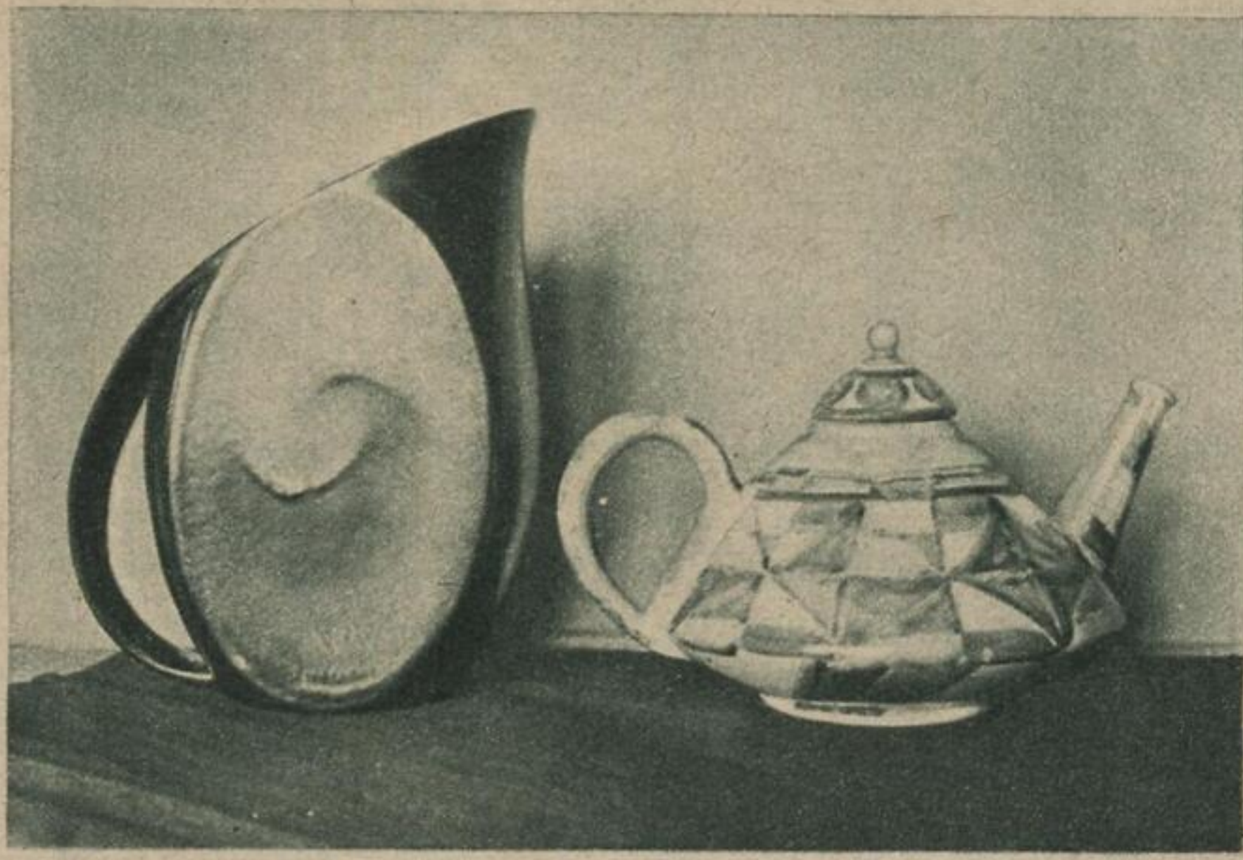
Neuzeitliche Kaffee- und Teekanne aus Veltener Fayence