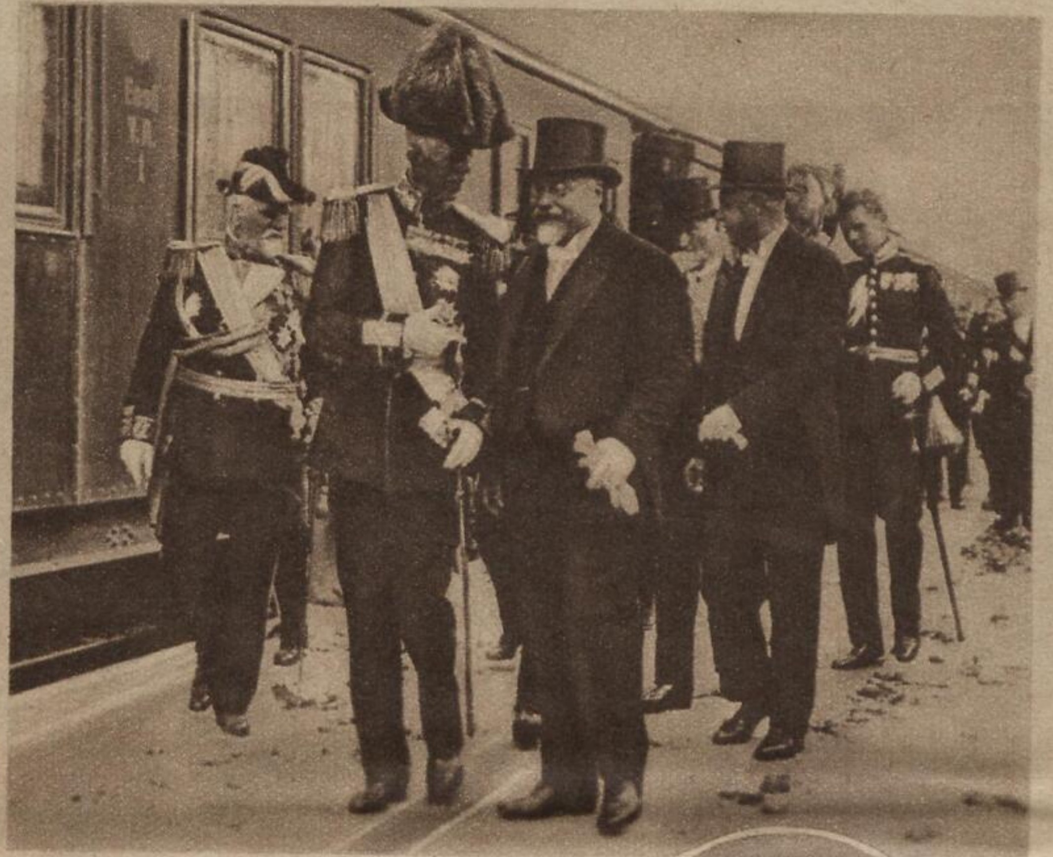
König Gustav von Schweden traf in der lettischen Hauptstadt Riga zum Besuch ein und wurde vom Staatspräsidenten Semgal und den Behörden herzlich empfangen S. B. D.