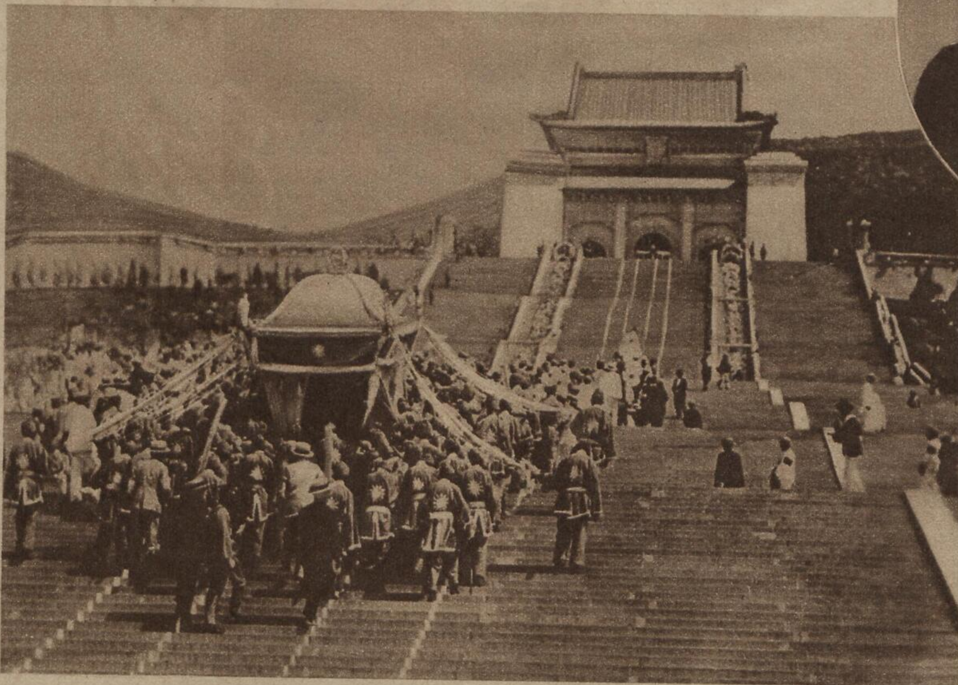
← Bild links: Die Weisung des Vaters der großen chinesischen Revolution, Sun Yat Sen, der in seinem Lande als die Verkörperung des Willens zur nationalen Unabhängigkeit gefeiert wird, in der neuen Hauptstadt Hanking S. B. D.