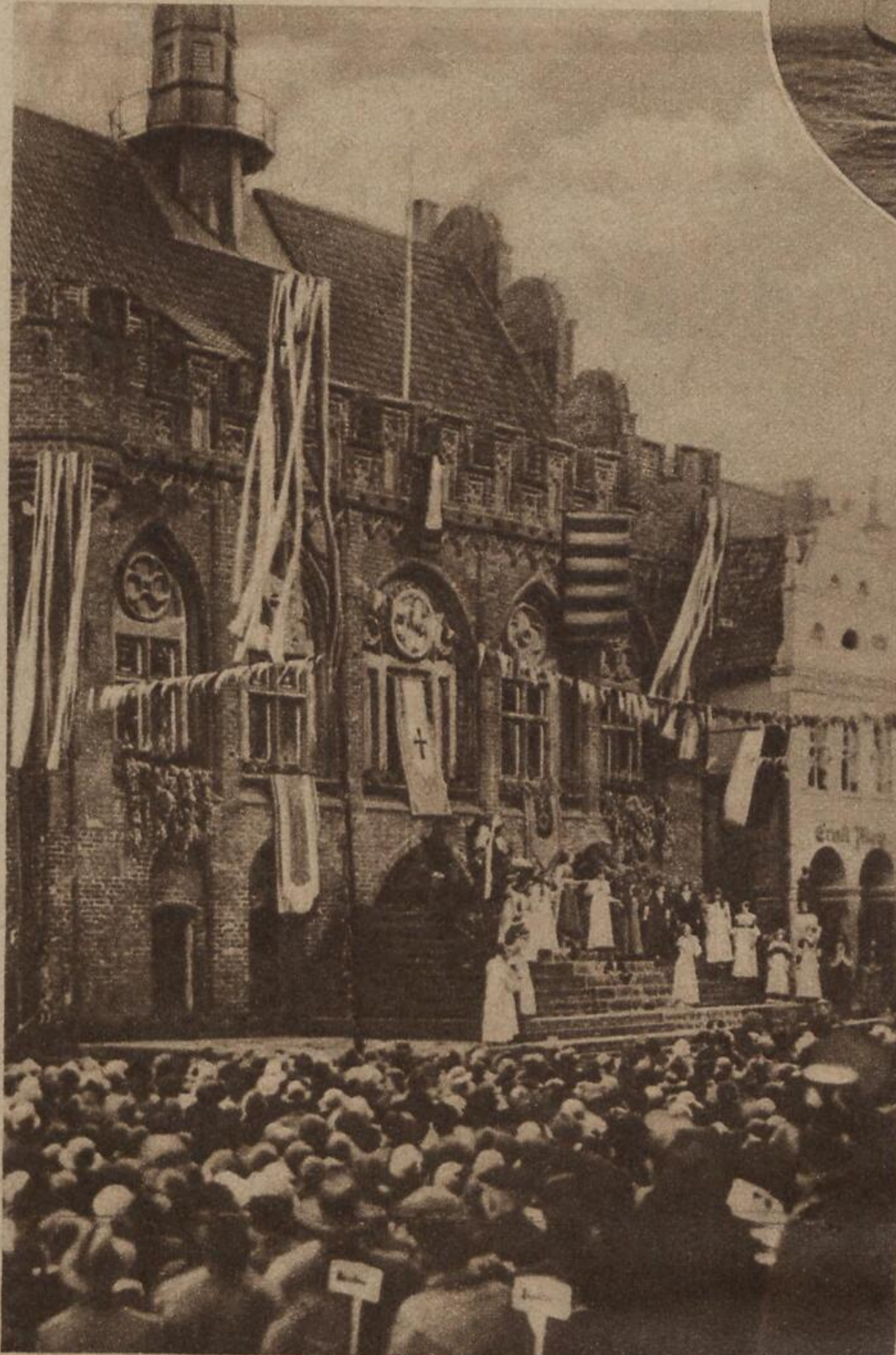
„Volk in Not“. Diese historische Trilogie gelangte im Rahmen der diesjährigen Marienburger Freilicht-Festspiele unter Mitwirkung von fast 500 Personen, darunter 30 bedeutenden Schauspielern, vor dem 1360 erbauten Rathaus zur Aufführung S. B. D.