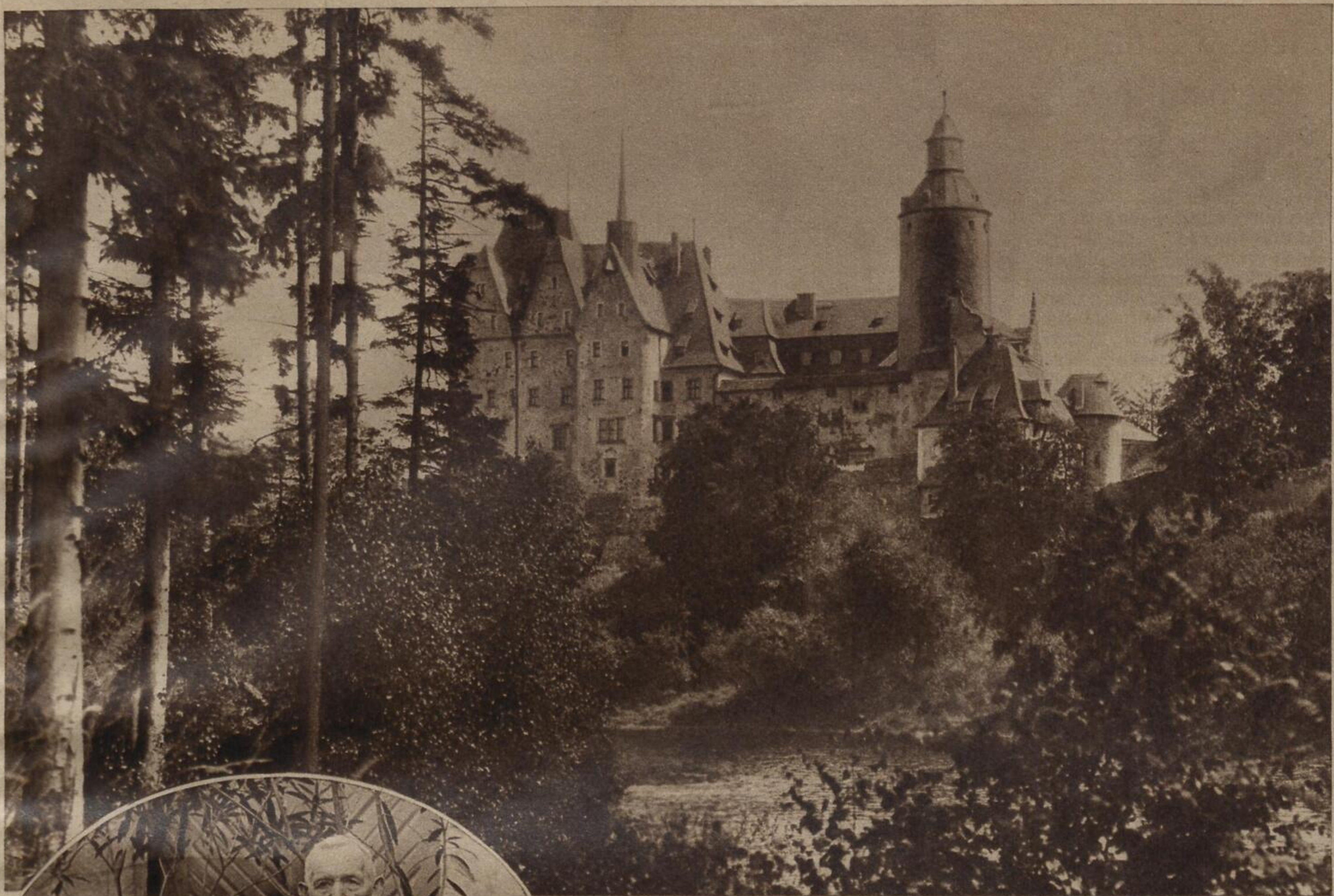
Die im schönen Queistale gelegene Burg Tschochau nahe Marklissa kann in diesem Jahre auf ein 600jähriges Bestehen zurückblicken. Auch sie wurde vor wenigen Jahren von dem bekannten Burgen-Wiedererbauer Prof. Ebhardt neu hergerichtet Kiefewalter