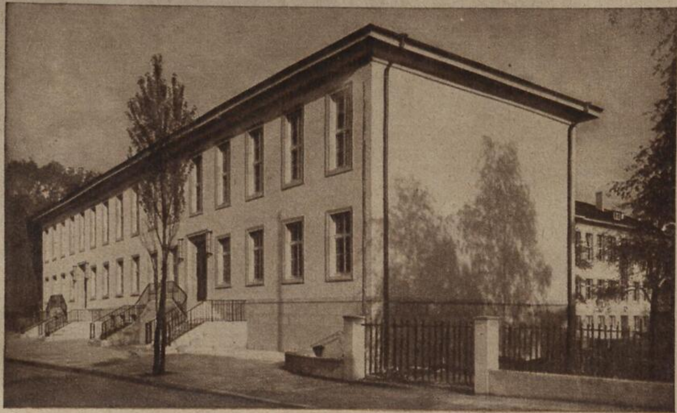
Bild rechts: Das neue mathematische Institut der Göttinger Universität ist bezugsfertig; die feierliche Einweihung soll im Dezember erfolgen. Die Errichtung dieses Institutes wurde durch eine Stiftung des amerikanischen Petroleumkönigs Rockefeller ermöglicht, die der bedeutendsten mathematischen Fakultät der Welt zugeordnet war. Als solche wurde nach jahrelangen Prüfungen und Verhandlungen die Göttinger angenommen