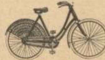
No. 47. Elegantes Damenrad. Preis 188 Mark.