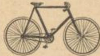
No. 43. Feiner Halbrenner Preis 188 Mark.