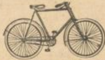
No. 41. Prima Tourenrad. Preis 188 Mark.